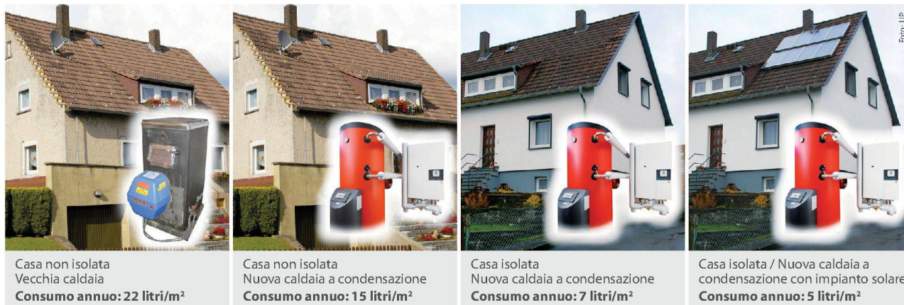
Casa non isolata Vecchia caldaia Consumo annuo: 22 litri/m 2