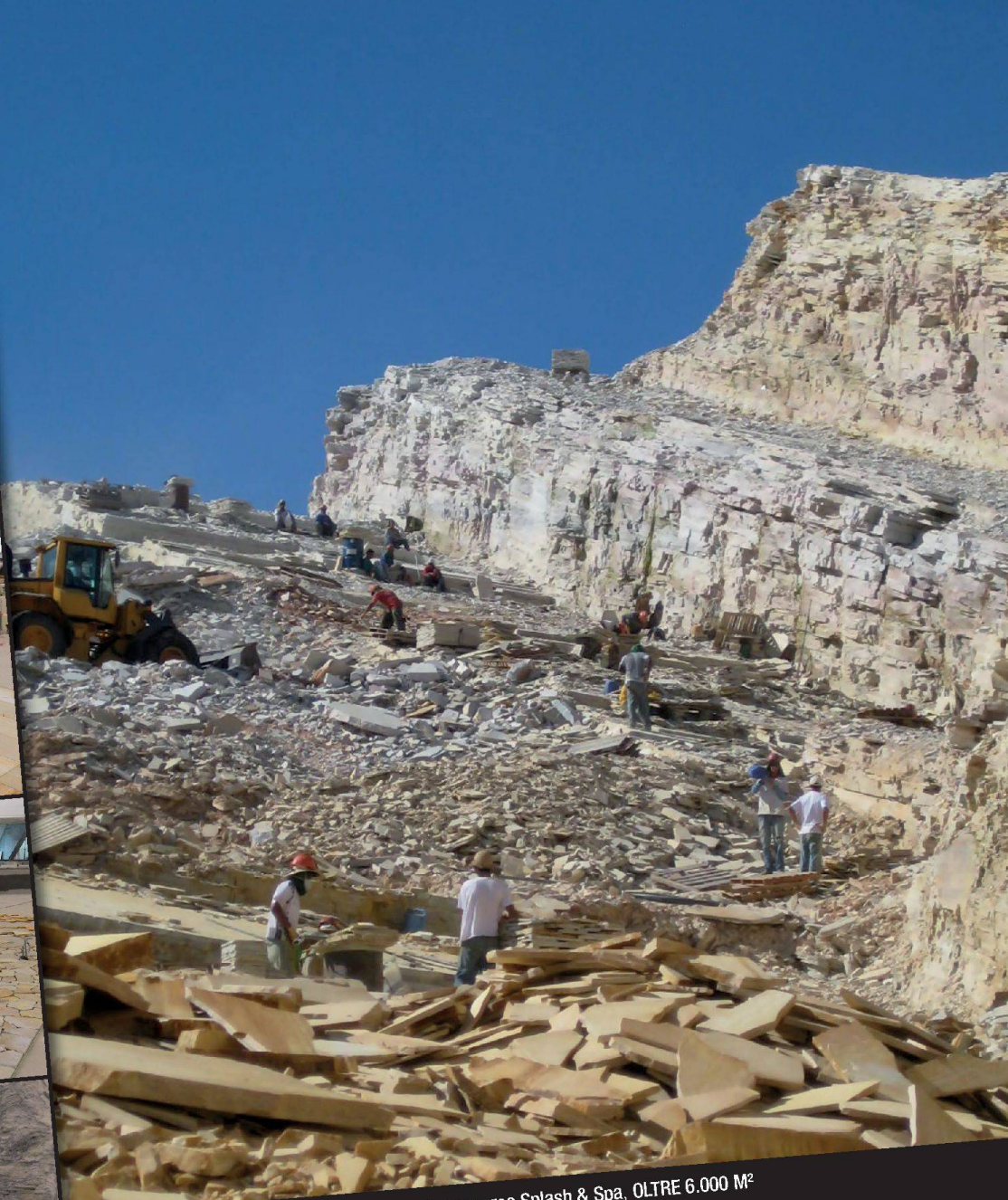
QUARZITE BRASILIANA - Centro Spa di Riviera, Acquaparco Splash & Spa, OLTRE 6.000 M 2

La pietra naturale rappresenta da oltre 90 anni la nostra passione; da tutto il mondo importiamo e trasformiamo la pietra in opere d'eccellenza, mediante l'ausilio delle più moderne tecnologie.