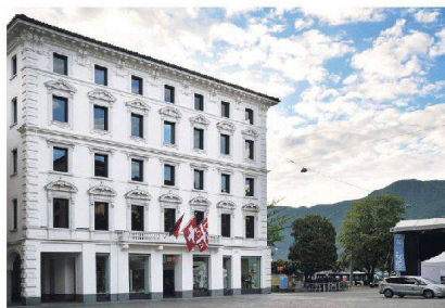
Piazza Riforma - Lugano