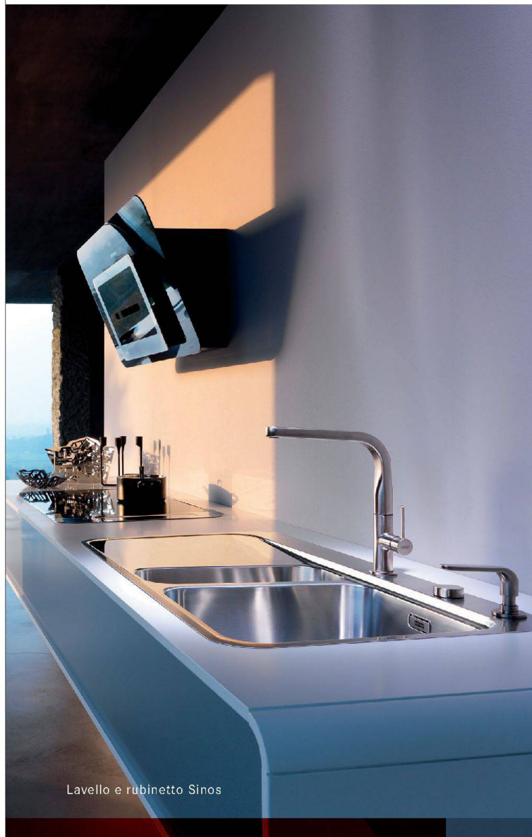
Lavello e rubinetto Sinos

Keramik Laufen AG Wahlenstrasse 46 4242 Laufen t. +41 (0) 61 765 71 11 forum@laufen.ch www.laufen.com/ch