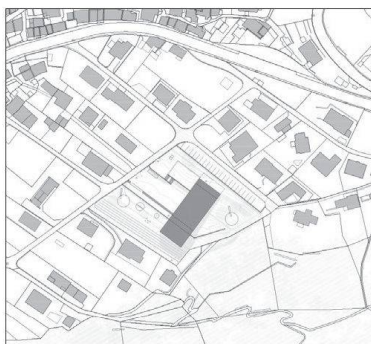
Comunità di progettazione CHP architetti