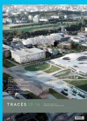
Tracés n. 13-14 CONSTRUIRE L'IMAGE DU CAMPUS www.revue-traces.ch