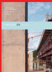
Tracés n.09 N16 - Viaducs Eaux des Fontaines www.revue-traces.ch

Nel prossimo numero La finestra nell'architettura ticinese Dello stesso editore