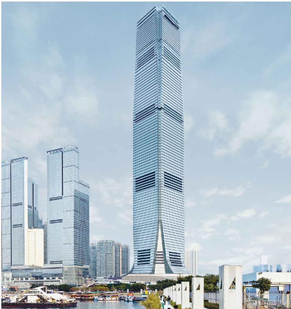
International Commerce Centre, Hong Kong