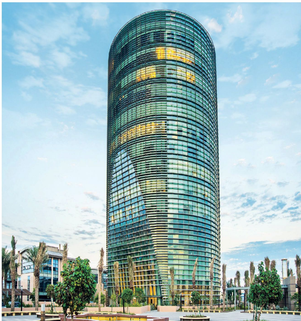
Alturki Business Park Al-Kohbar, Saudi Arabia