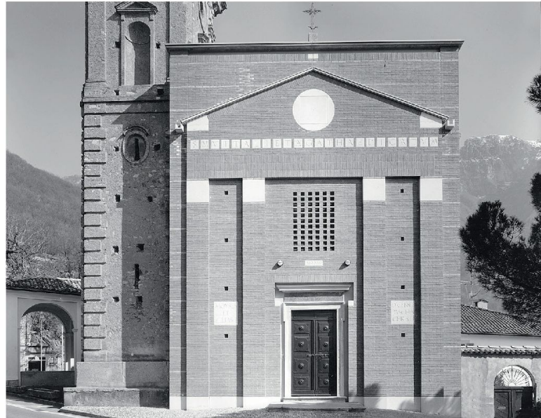
Facciata Chiesa Parrocchiale dei Santi Vitale e Agata Rovio, 1996-97.