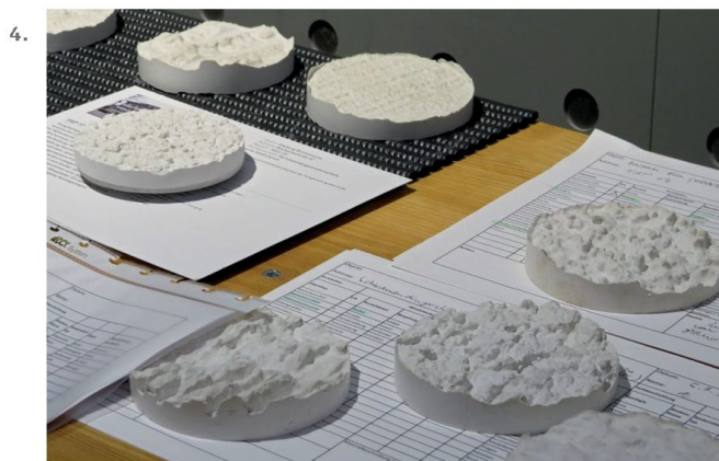
Haus der Farbe Zurigo-Berlino