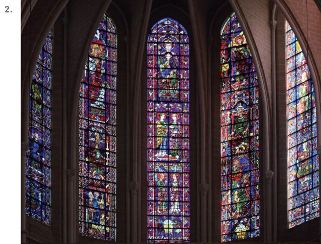
2. Notre-Dame di Chartres, luminosità all'interno del coro, dopo i recenti restauri.