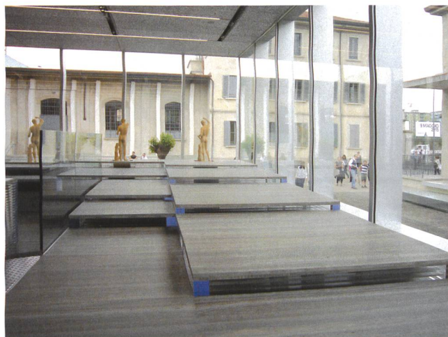
3. Milano, Fondazione Prada, vista di uno spazio aperto