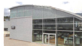
AMAG Lugano-Breganzona Satinatura completa dei vetri.

Studio B Image SA Lugano-Giubiasco 091 857 48 42 studio-b.ch