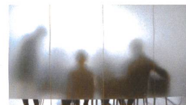
Ufficio Amministrativo Satinatura vetri per privacy.