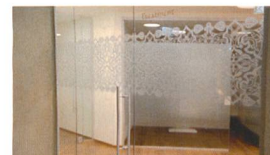
Splash e Spa Tamaro Satinatura vetri con motivo personalizzato