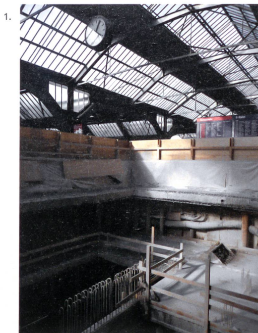
1. Straordinaria opera ingegneristica: Passante di Zurigo, costruito nel cuore della città, senza interrompere il traffico ferroviario.

Il lavoro svolto dagli ingegneri civili svizzeri è immenso, anche se in seno all'opinione pubblica sono spesso poche le parole spese al riguardo. In generale il rico-