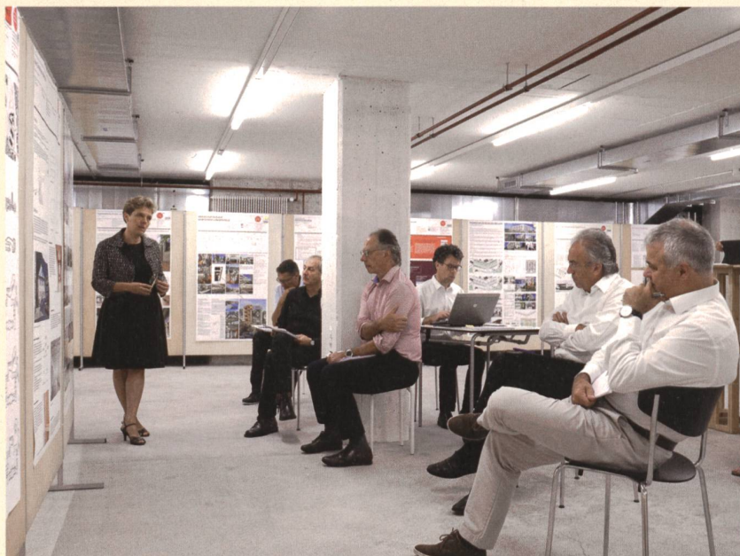
Discussione durante una riunione di giuria: per prendere la decisione giusta, è fondamentale poter formulare una valutazione imparziale.

I seguenti esempi mostrano chiaramente quanto complesse possano essere le questioni che concernono la parzialità e le ricusazioni.