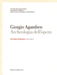
Giorgio Agamben Archeologia dell'opera Mendrisio Academy Press, Mendrisio 2013