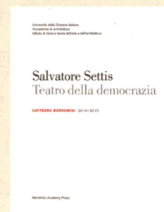
Salvatore Settis Teatro della democrazia Mendrisio Academy Press, Mendrisio 2016

dente francese si lanciò in una campagna di rinnovamento della capitale.