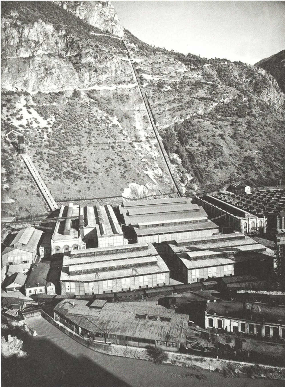
Teilansicht des Fabrikgeländes der AIAG in Chippis während des Ersten Weltkriegs. Der Sprengstoffanschlag erfolgte gegen die rechte der beiden vom Berghang herunterführenden Leitungen. Das Salpetersäurewerk befand sich in den drei unmittelbar darunter liegenden, orthogonal zur Druckleitung verlaufenden Fabrikhallen.