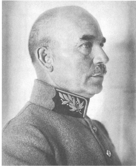
Fritz Gertsch als Oberstdivisionär, 1918 (Bild: Graphische Sammlung, Schweizerische Nationalbibliothek).

Fritz Gertsch (1862-1938) gehörte um die Jahrhundertwende zu den umstrittensten Offizieren der Schweizer Milizarmee. Als menschenverachtender Soldatenschinder verschrien, als streitlustiger Militärpublizist über die Landesgrenzen hinaus bekannt, sorgte der umtriebige Instruktionsoffizier zeitlebens für Aufsehen und Unruhe im schweizerischen Offizierskorps. Er exponierte sich schon früh als harscher Kritiker der etablierten Ausbildungs- und Gefechtskonzepte und forderte eine Anpassung des für die Schweizer Milizarmee typischen republikanisch-egalitären Führungs- und Erziehungsstils an denjenigen der damaligen Modellstreitkraft in Europa: die preussisch-deutsche Armee.