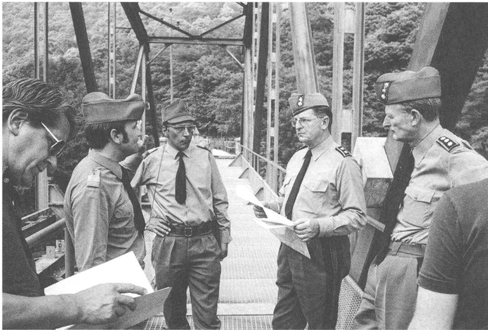
Korpskommandant Hans Senn (rechts) und Divisionär Frank Seethaler (zweiter von rechts) im Jahre 1976 bei einem Manöver im Tessin.

Leiter der Operationsabteilung des Schweizer Generalstabs (1964–1969), als Kommandant des Feldarmee Korps 4 (1972–1976) und schliesslich als Generalstabschef (1977–1980). 5