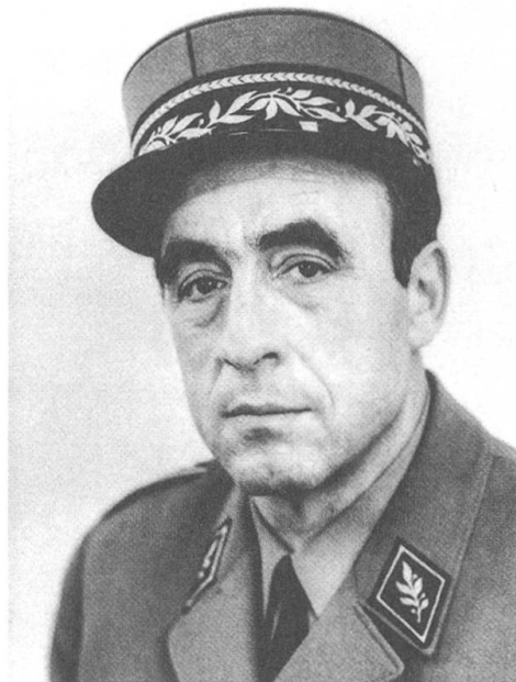
Letzter Verfechter der «Nationalen Richtung»? Alfred Stutz als Direktor der Militärwissenschaftlichen Abteilung der ETH Zürich.

Die Konzeption 66 der militärischen Landesverteidigung diente der Schweizer Armee von 1966 bis 1994 als Heilige Schrift, welche Kampfverfahren, Mittel und Ziele des militärischen Kampfs festlegte, aber auch die Grenzen der Rüstungsfinanzierung aufzeigte. 1 Herausgegangen ist dieses Dokument aus einem fast 20 Jahre dauernden Konzeptionsstreit um die richtige Ausstattung und Kampfweise der Schweizer Armee nach Ende des Zweiten Weltkriegs. Ein Streit, bei dem es um mehr ging als um Flugzeuge, Panzer und Kanonen: Es ging um die dem Schweizer Volk adäquate Form der Landesverteidigung nach der ernüchternden Erfahrung im Zweiten Weltkrieg. Durch das tiefe Niveau der Mechanisierung und Motorisierung der Armee und der Einkreisung durch die Achsenmächte war damals nur noch der Rückzug ins Alpenréduit übrig geblieben.