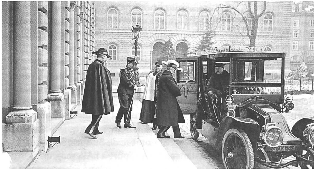
La légation française à Berne exerçait une forte influence sur les relations franco-suisse. Ci-dessus l'attaché militaire après la réception du Nouvel An 1915 au Palais fédéral.

contribuèrent au renforcement de la confiance française dans la volonté suisse de défendre la neutralité.