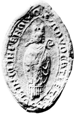
1. S r ADVOCATI · ET · CIVIUM · IN · CLINGENOWO.