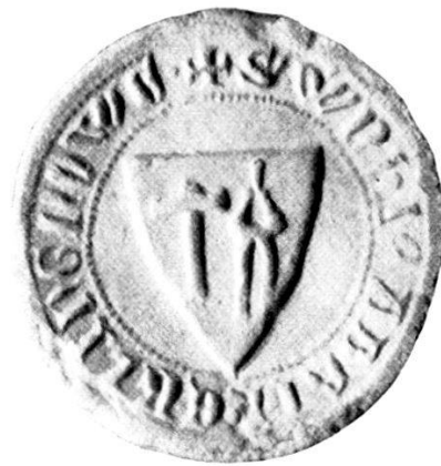
4. † S r W̄N̄HI · (F)ABRI · DE · KLINGNOWE.