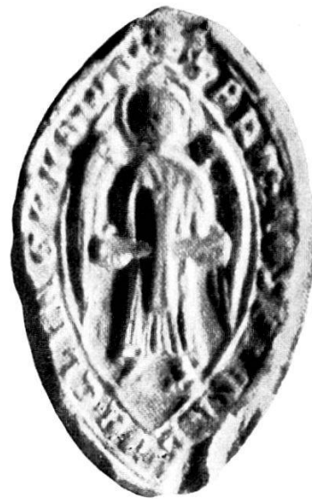
6. S r F̄RM · HOSPITAL(ARIORVM) · DE · CLINGENOWE.

1.—5. Stadtjiegel von 1278, 1500 und um 1700.