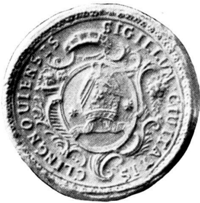
3. SIGILLUM · CIUITATIS · CLINGNOUIENSIS.