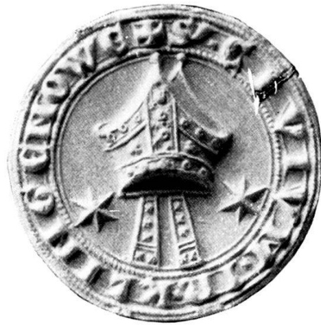
2. † S r CIVIUM · IN · KLINGENOWE.