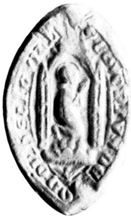
5. S r CONVENTUS · DE · (SI)ON · ORD · SCI · GVILELMI.