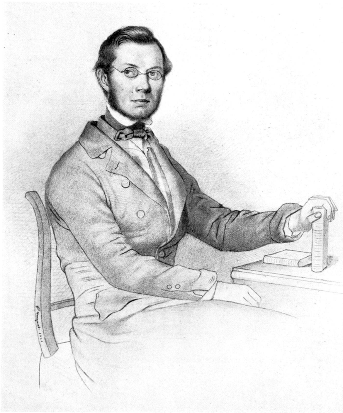
ERNST LUDWIG ROCHHOLZ