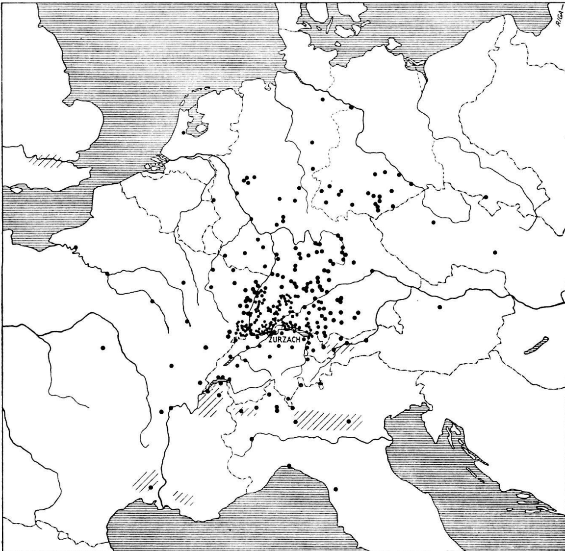
Karte IV: Herkunftsorte der ausländischen Messebesucher im 18. Jahrhundert

• in den Akten angeführte Herkunftsorte /// in den Akten angeführte Herkunftsgebiete