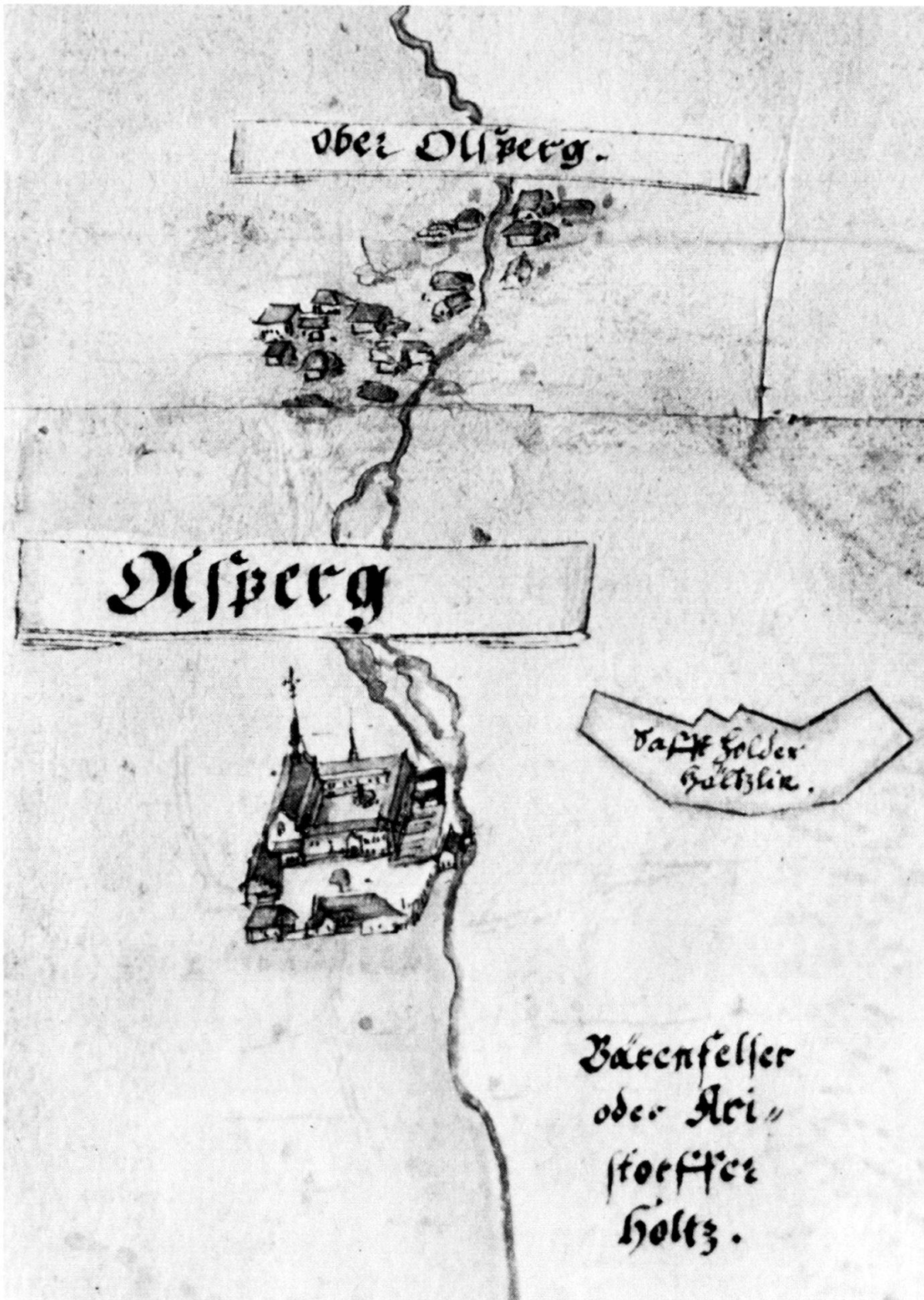
Kloster und Dorf Olsberg von Westen, um 1602