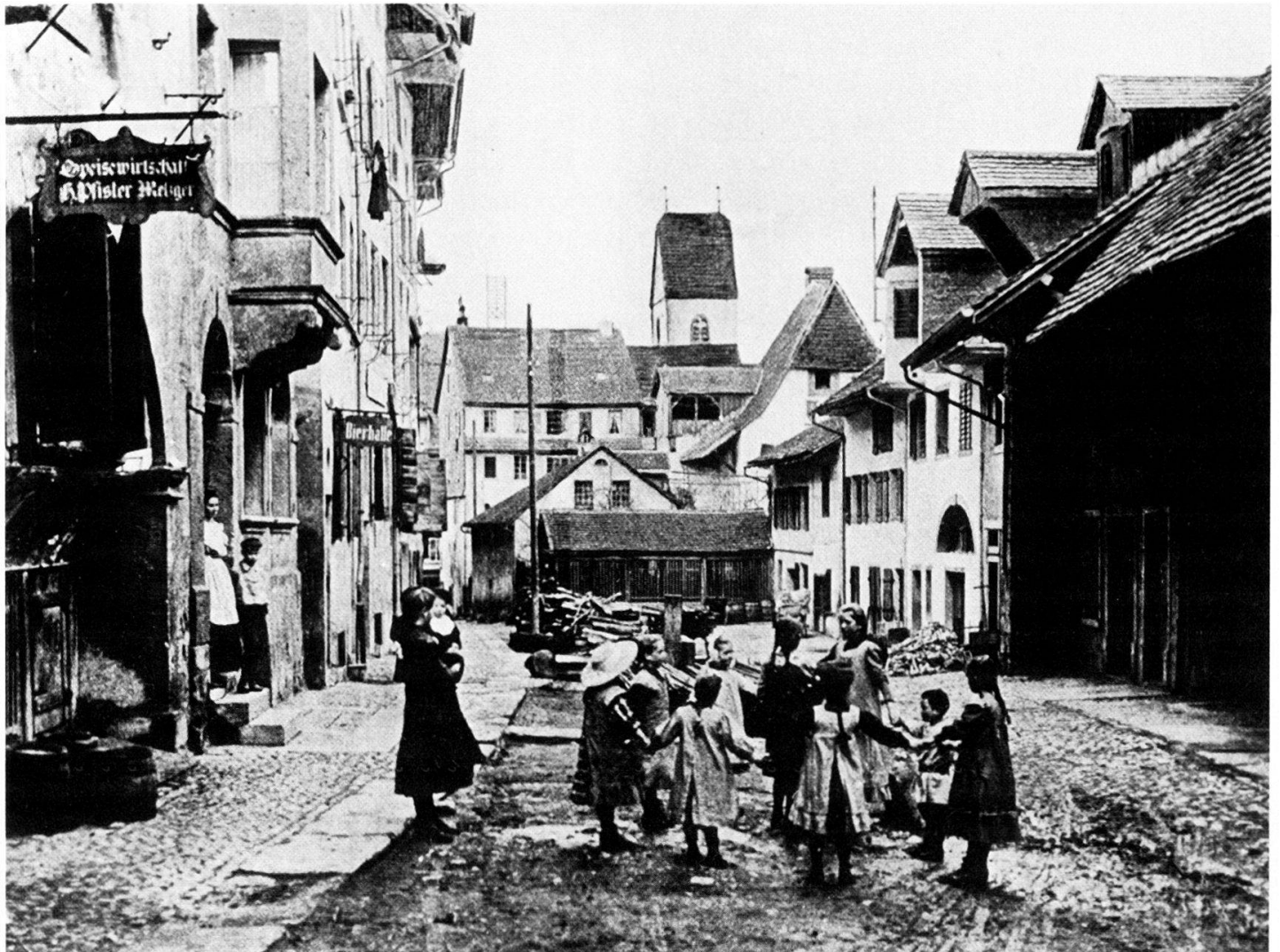
Abbildung 35: Henschiker Kirchweg – typisch für Lenzburg während Jahrhunderten: Handwerker, die gleichzeitig noch Landwirtschaft treiben. Handwerksboutiquen links, Ökonomiegebäude rechts auf dem Bild, dazwischen spielende Stadtjugend