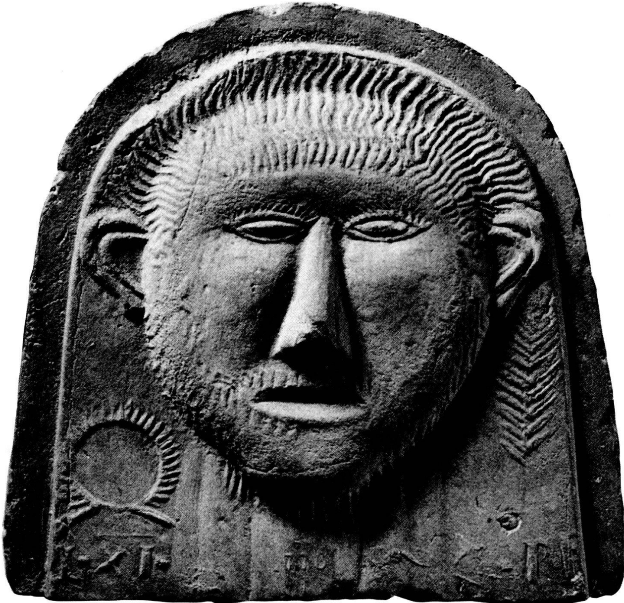
Stirnziegel mit Darstellung eines Gallierkopfes, Abbildung aus «Die Römer im Aargau»