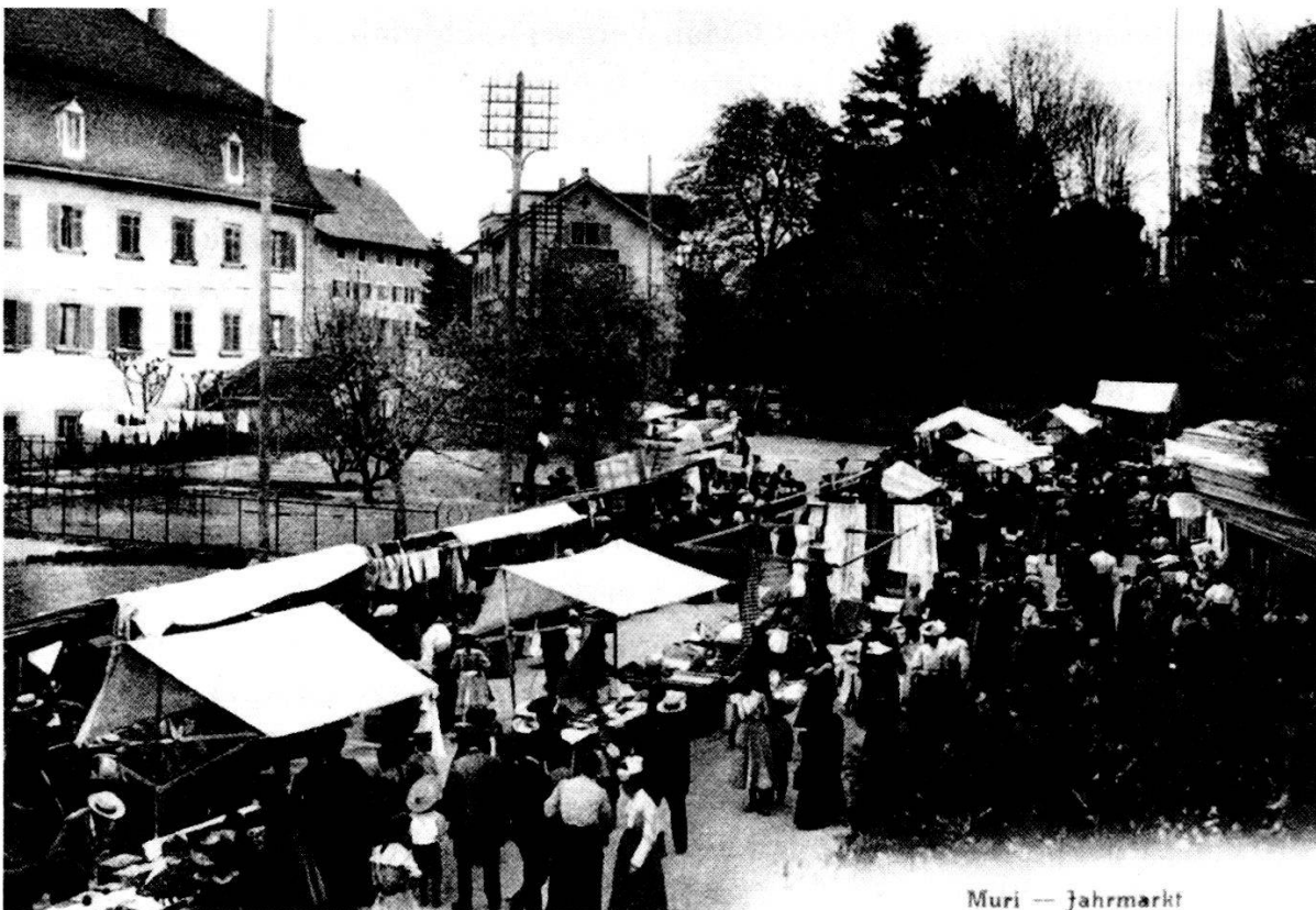
Muri — Jahrmärkt

Wieder einmal, es war unterdessen 1877 geworden, entschloss sich der Gemeinderat im Einverständnis mit den Bürgern, die Regierung nochmals um einen fünften Jahr- und Viehmarkt zu bitten. Zwei Jahre geschah aber nichts. Erst am 24. August 1879 beschloss die Gemeindeversammlung, es möchte auf das Fest Mariä Geburt ein fünfter Markt «anbegehrt» werden 42 . Der Gemeinderat begründete das Gesuch mit der Feststellung, dass seit dem Betrieb der Eisenbahn bis Muri die Jahrmärkte und besonders die Viehmärkte ein grosses Bedürfnis seien. «Wir sind überzeugt, dass die Viehmärkte in Muri als dem Mittelpunkt einer grossen Viehzucht und Viehhandel treibenden Bevölkerung besonders wichtig und berühmt werden, sobald die Eisenbahn weiter fortgesetzt sein wird.» Die Einführung eines weiteren Viehmarktes sei für die Gegend ein Bedürfnis, denn im Herbst müsse sich mancher Landwirt nach Zugvieh umsehen. Der 8. September, der ehemalige Festtag Mariä Geburt, werde sich als Markttag besonders eignen, da an diesem «abgerufenen Feiertag» viele Landwirte lieber einen Markt besuchen als auf dem Felde arbeiten 43 . Am Schlusse seines Schreibens meinte der