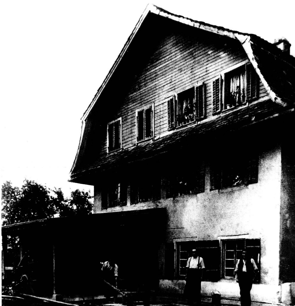
Einstige Schmiede Rüttimann in Dorfhuri

(Anm. Sektor 1: Urproduktion (Land- und Forstwirtschaft); Sektor 2: Industrielle Produktion, Handwerk; Sektor 3: Dienstleistung (Banken, Versicherungen, Gastgewerbe, öffentliche Verwaltung)