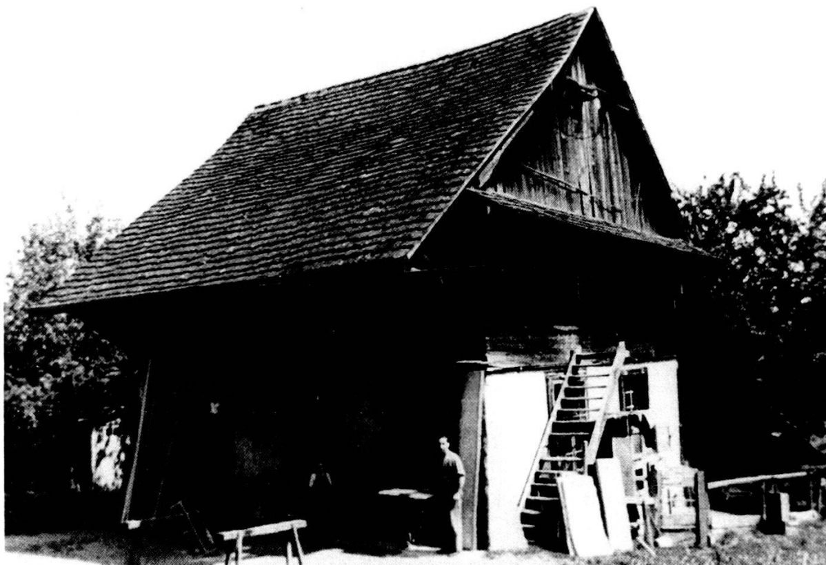
Einstige Schreinerei Lüthi im Vorderwey