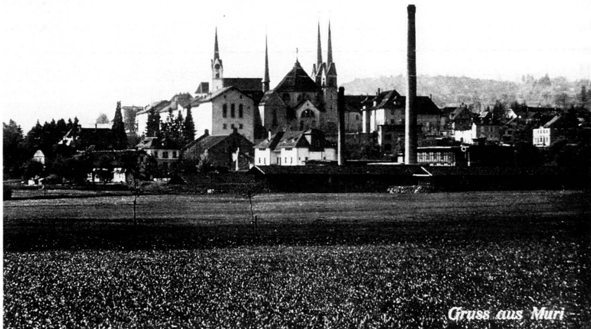
Ziegel- und Backsteinfabrik mit den beiden Hochkaminen. Heute als Lager verwendet