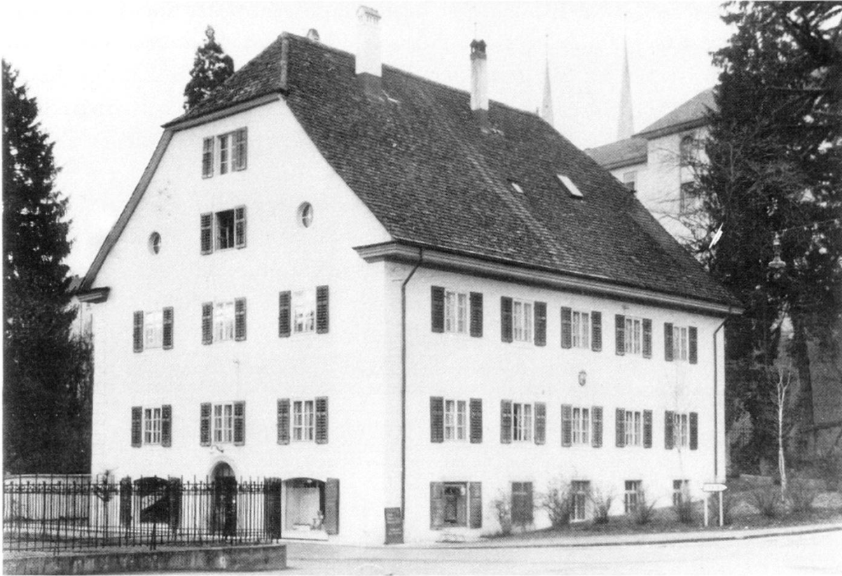
Haus der Strohfirma Stöckli-Gehrer, 1937 dem Aarg. Kranken- und Pflegeheim verkauft