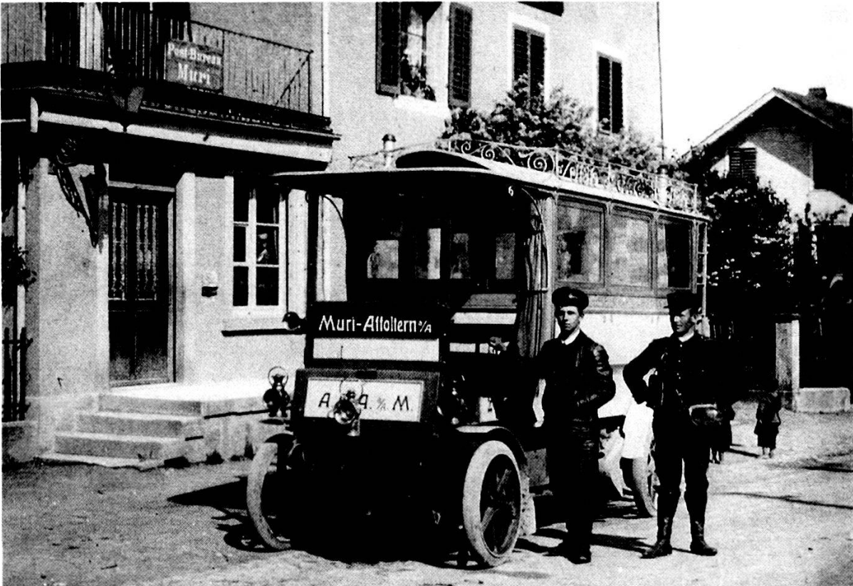
Postautoverkehr Muri-Affoltern a. A. 1906. Orion-Omnibus vor der alten Post an der Marktstrasse

Güterverkehr 2174.85 Fr. Diesen Beträgen standen Ausgaben von 20 531.90 Fr. entgegen, was zu einem Defizit von 7030.70 führte. Somit konnte für das erste Halbjahr keine Abschreibung vorgenommen und auch keine Dividende ausbezahlt werden. Betriebschef Steinmann schrieb dazu: «Das Winterhalbjahr wird punkto Frequenz an Einnahmen bedeutend kleiner, die Betriebsausgaben eher bedeutend grösser. Die Existenz unseres Verkehrs ist in Frage gestellt, um so mehr als die Preise für Benzin sehr gestiegen sind.» Für die nächsten sechs Monate rechnete man mit einem Defizit von 13 000 Fr. Das veranlasste die Gesellschaft, den Betrieb nach 9½ Monaten, am 15. Januar 1907, einzustellen. Die Gemeinde Muri hatte nach Vertrag 376 Fr. Garantie zu leisten 55 .