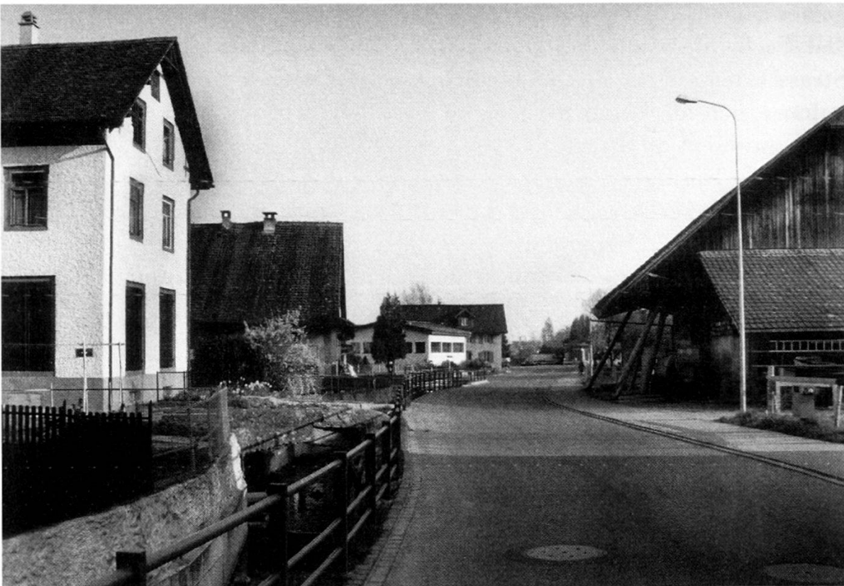
Gleiche Ansicht heute