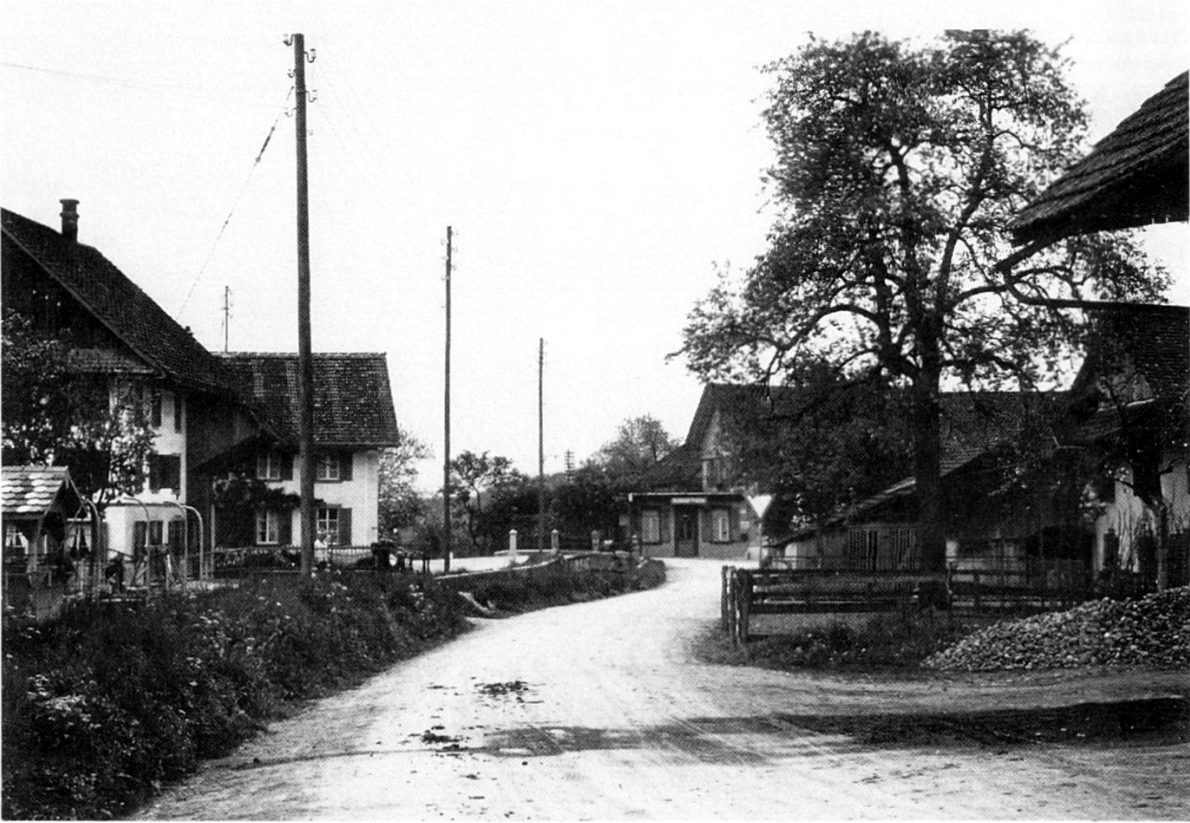
Bachstrasse in Dorfmuri mit Blick gegen das Restaurant Frohsinn