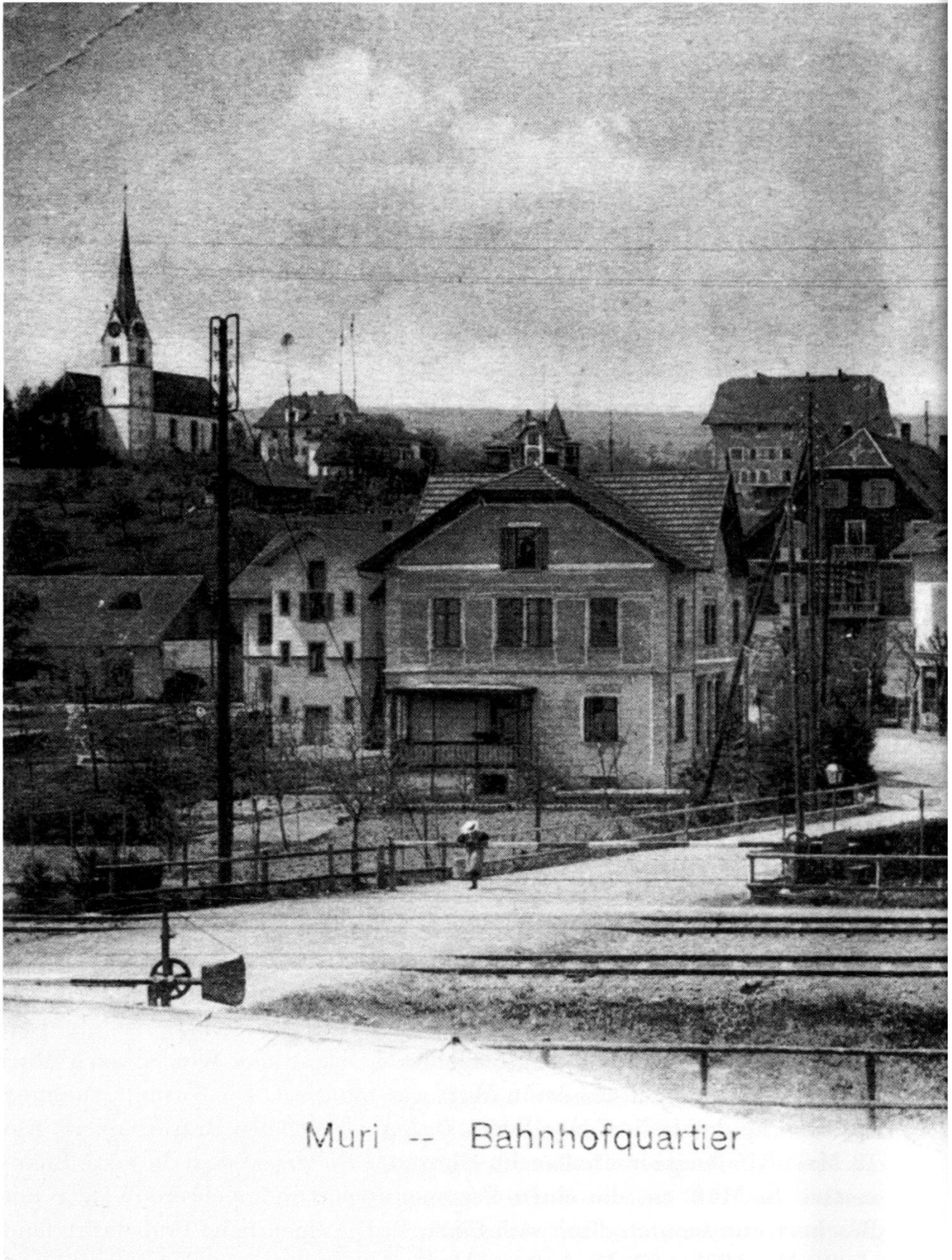
Muri -- Bahnhofquartier