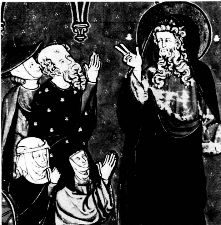
Bibliothèque Nationale Paris. Ms. nouv. acq. fr. 16251, fol. 20v.