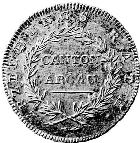
Abb. 5: Schulprämien des helvetischen Erziehungsrates.

In der philanthropischen Erziehungslehre hatte die formelle Belohnung einen hohen Stellenwert. Der helvetische Bildungsminister Stapfer hielt die Erziehungsräte an, das Mittel der Prämien zur Verbesserung des Schulwesens intensiv einzusetzen.