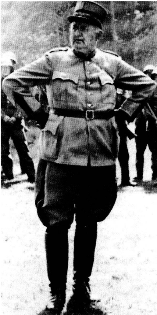
Abb. 3: Eugen Bircher

(Leider war es mir nicht möglich, irgendwelche konkretere Beispiele von faschistischen Übergriffen im Aargau während des Zweiten Weltkriegs zu finden. Die Informationen oder Zahlen darüber konnte ich in keinem Buch oder in einer anderen Informationsquelle finden. Doch ich denke, nur dieses Beispiel zeigt die durchaus vorhandene Bereitschaft zur Kooperation mit dem faschistischen Deutschland von einigen Gruppierungen und Personen im Aargau ziemlich gut.)