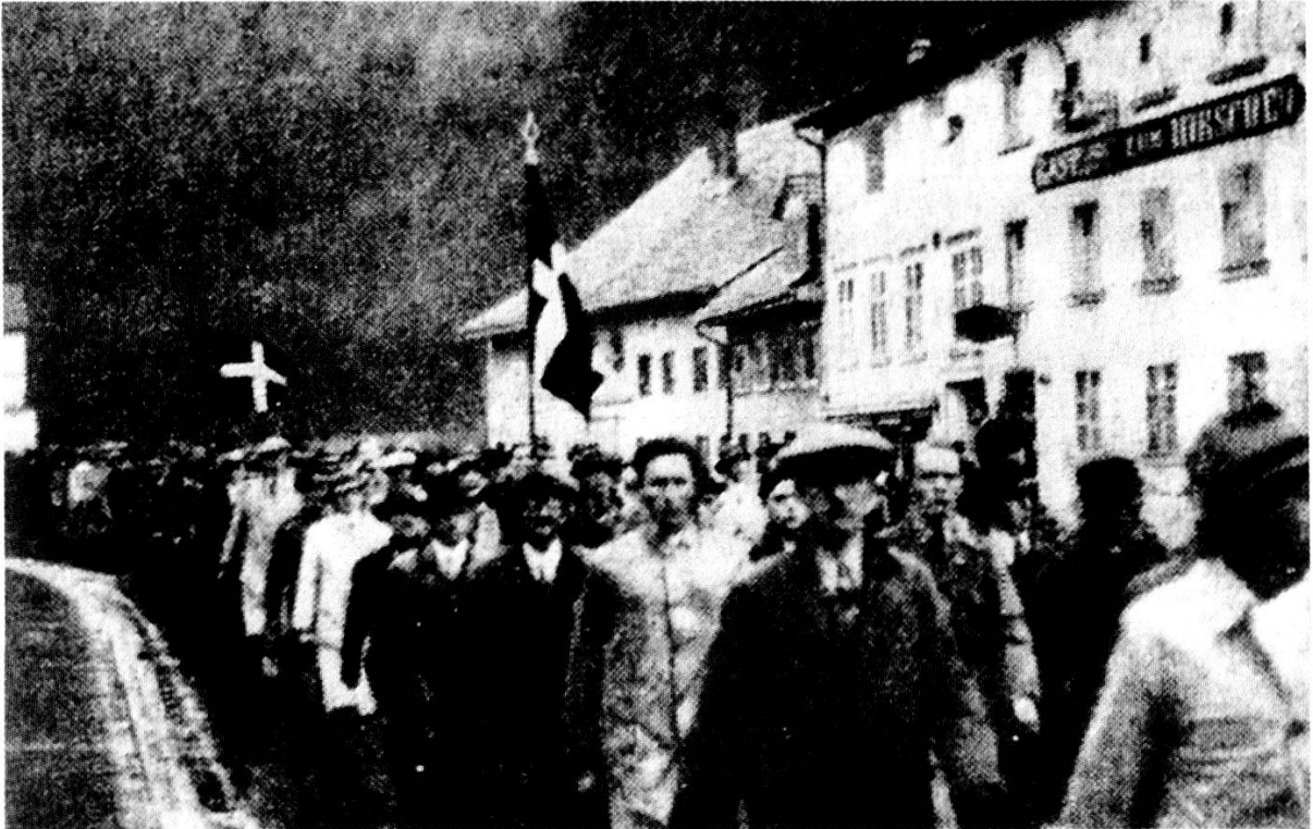
Abb. 2: Aufmarsch der Nationalen Front 1934

aufwies. Damit war die öffentliche Frontenbewegung gescheitert. Die NF löste sich im Mai 1940 selbst auf. Doch damit war der Faschismus im Aargau noch lange nicht Vergangenheit.