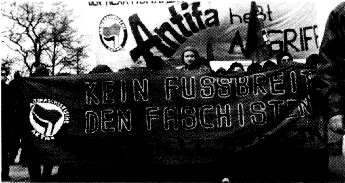
Abb. 7: Antifas an der Gegendemo vom 1. März 1997