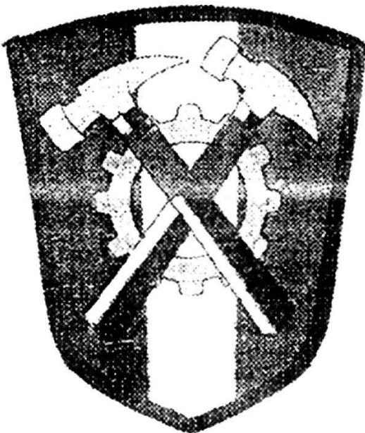
Abb. 4: Abzeichen der SHS