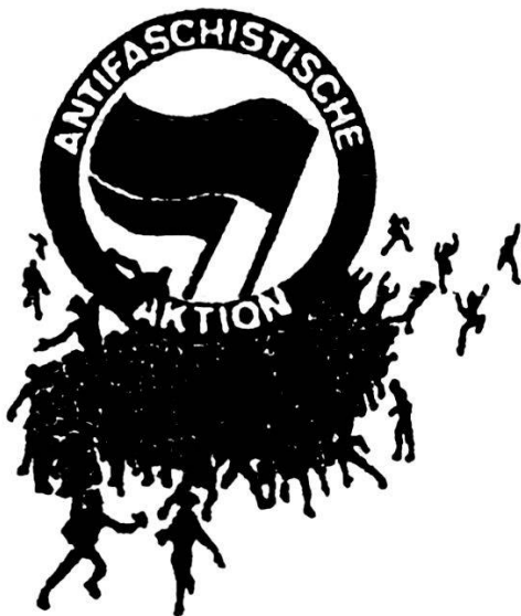
Abb. 6: Symbol der Antifaschistischen Aktion

Der Antifaschismus verlangt keine perfekten Menschen, aber Menschen, die bereit sind, zu dem zu stehen, was sie tun, die sich hinterfragen und versuchen, aus Fehlern zu lernen, anstatt blind und kopflos einem Führer hinterherzulaufen. Auch ein wichtiges Ziel des Antifaschismus ist es, Vorurteile abzubauen, damit Begegnungen zwischen verschiedenen Kulturen stattfinden können.