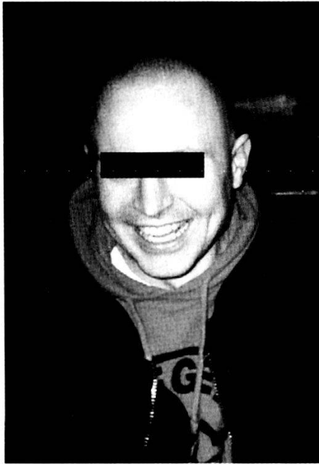
Abb. 1: Aargauer SHARP-Skinhead

gehen die Red-Skins, eine Vereinigung von Skinheads mit linkem Gedankengut.