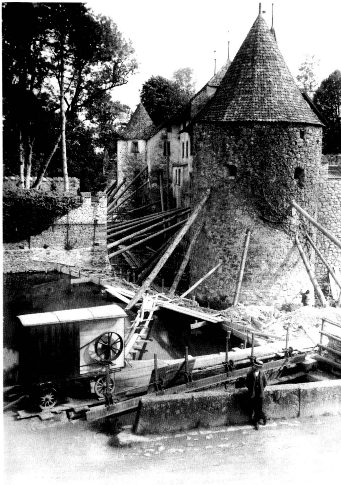
Abb 18: Das hintere Schloss während der archäologischen Grabungen 1911.