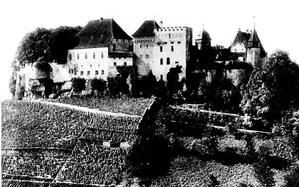
Abb. 21: Schloss Lenzburg von Südosten, nach den Umbauten 1893–1910, Photographie um 1925. Historisches Museum Aargau, Schloss Lenzburg, C 9939.