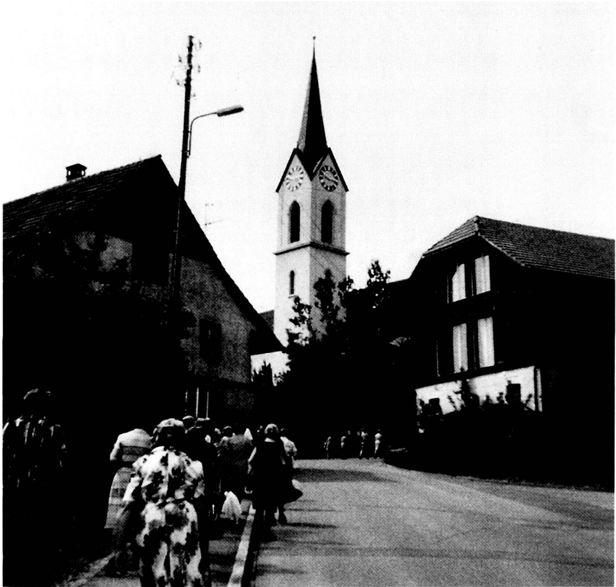
Rege benutztes Trottoir der ausgebauten Zelglistrasse, 1978.

werden: «Der Behörde sind die teilweise prekären Strassenverhältnisse in unserer Gemeinde bekannt. [Der Gemeinderat] gibt seiner Hoffnung Ausdruck, in absehbarer Zeit Verbesserungen vornehmen zu können.» 70 Ein zweiter hauptamtlicher Gemeindearbeiter wurde angestellt, vor allem aber ein systematischer Ausbau und die Asphaltierung der Nebenstrassen vorgenommen, was bis in die 1980er-Jahre andauerte. 71 Die Ausbaustrategie erfuhr jedoch gegen Ende der 1970er-Jahre eine Korrektur. So äusserte der Gemeinderat 1984 anlässlich einer Strassenerschliessung eines neuen Quartiers: «Heute ist man allgemein von der bisher eingehaltenen Strassenausbaueuphorie abgekommen. Man erstellt keine ‹Rennbahnen› mehr [...].» Vielmehr solle man den Verkehr zur Beruhigung zwingen, erklärte der Gemeinderat weiter. 72