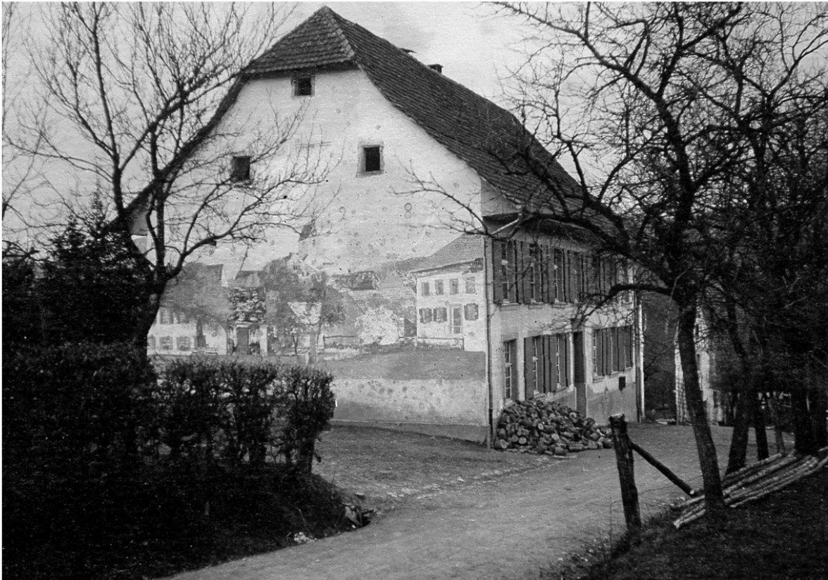
Schulhaus Wegenstetten. Erbaut 1828–1830 (StAAG NLA-0001/0001, Nachlass Josef Ackermann).

teinschulen. Deren Besuch war eine Voraussetzung, um reformierter Geistlicher zu werden.