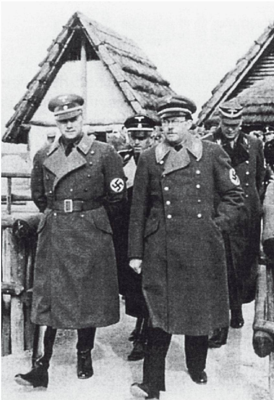
Herbst 1937: Reinerth (mit Brille) an der Seite von Reichsleiter Rosenberg. 6

Seine Versuche, sich in der Schweiz erneut nützlich zu machen, lösten gegensätzliche Reaktionen aus. Für einige war er ein hochrangiger Nationalsozialist, der