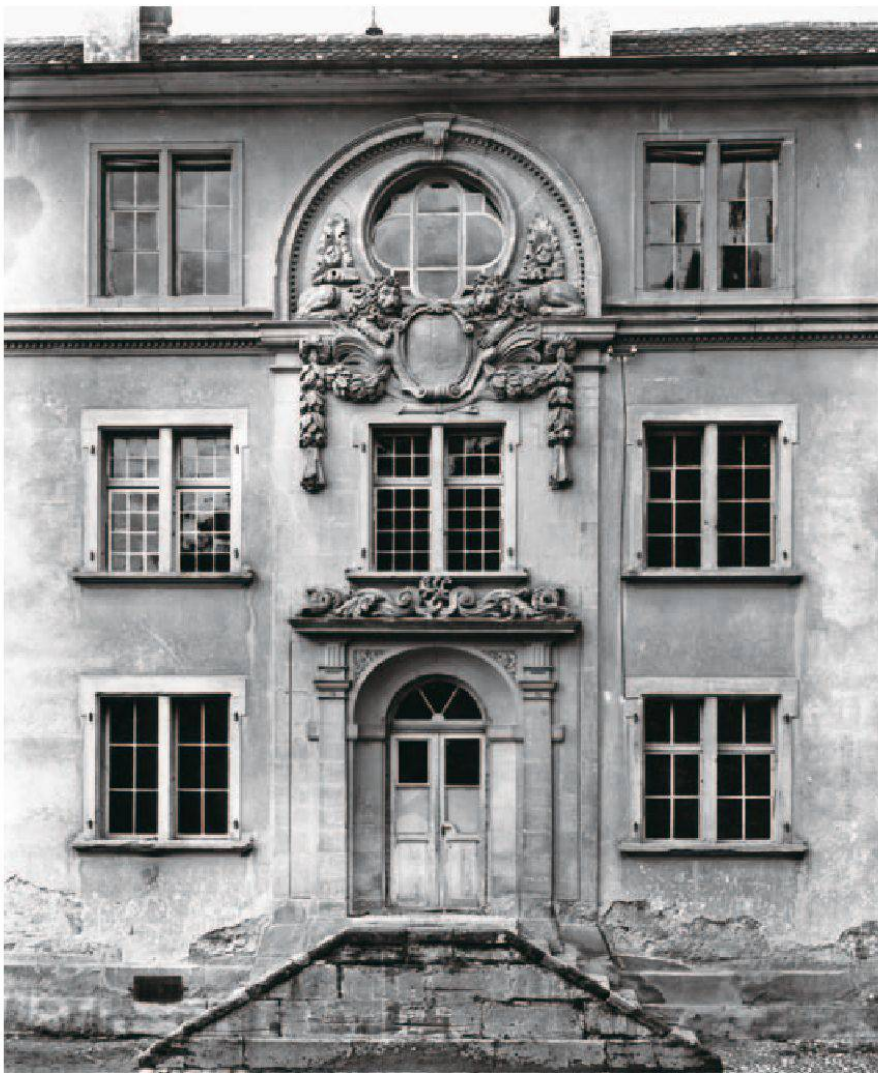
1 Der Riss zum östlichen Hauptportal der alten Hochschule in Bern (abgebrochen) wird Samuel Jenner zugeschrieben. Jenner projektierte die Arbeiten zu dem Bau ab 1679.