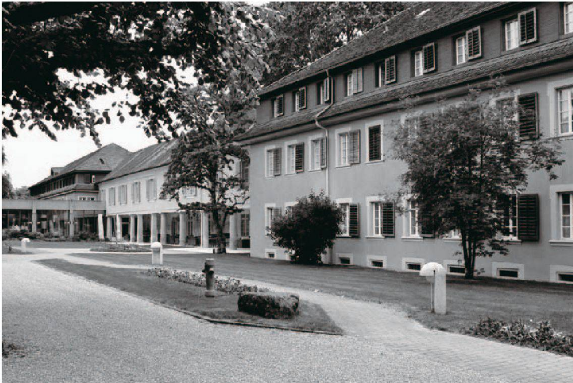
2 Die beiden durch einen Laubengang verbundenen Kurhäuser in Schinznach Bad wurden durch Samuel Jenner 1696 und 1704 fertiggestellt.