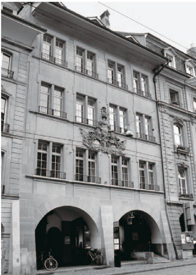
5 Das Haus der Gesellschaft zum Distelzwang in Bern wurde 1701 vollendet (Foto: Manuel Kehrl, 2012).

mit einem abgerundeten Fensterbrett. Während die Kurhäuser verputzt sind, ist die Distelzwang-Fassade in Haustein ausgeführt und die Fenster sind mit einer Brustplatte unterlegt. 18 1704 erweiterte Jenner das Kurhaus um einen nördlich daran angrenzenden Zwillingsbau. Die beiden Bauten wurden mit der Bäckerei und den Stalungen durch ein Peristyl verbunden. Die beiden Bauten Jenners haben sich bis heute im Wesentlichen erhalten, lediglich das Mansardengeschoss wurde umgebaut. Zu den beiden barocken Bauten gesellten sich in den letzten 300 Jahren diverse Erweiterungsbauten.