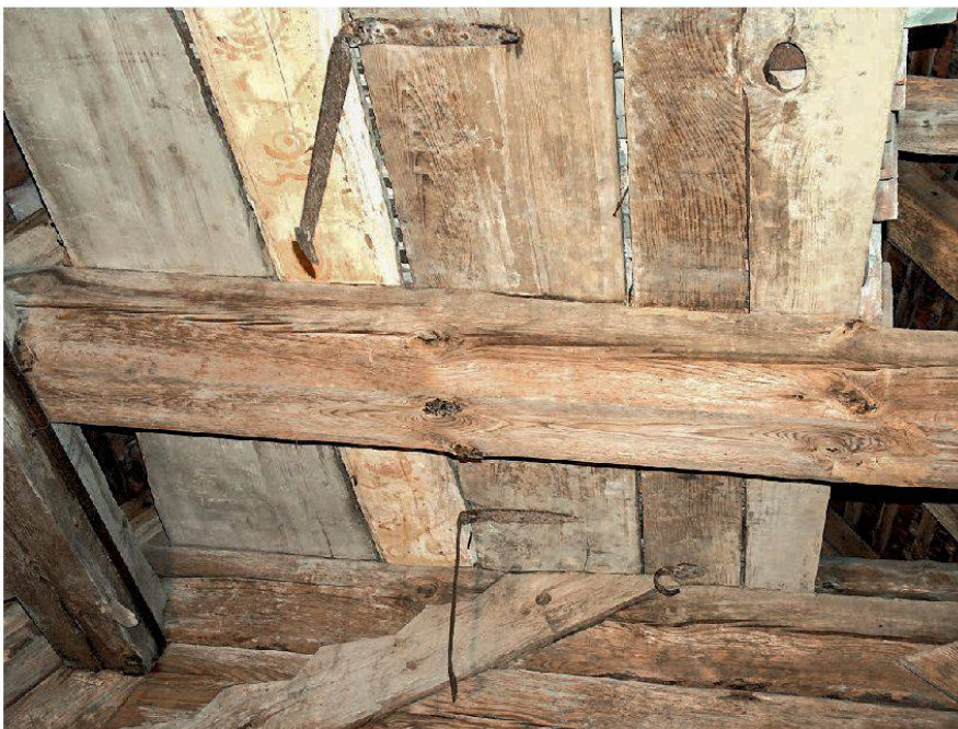
2 Boden und Seitenwände des «Pestsargs» von Mandach bei der Auffindung im Estrich der Kirche von Mandach 2004. Das schmalere, bemalte Brett gehört nicht zum Pestsarg.