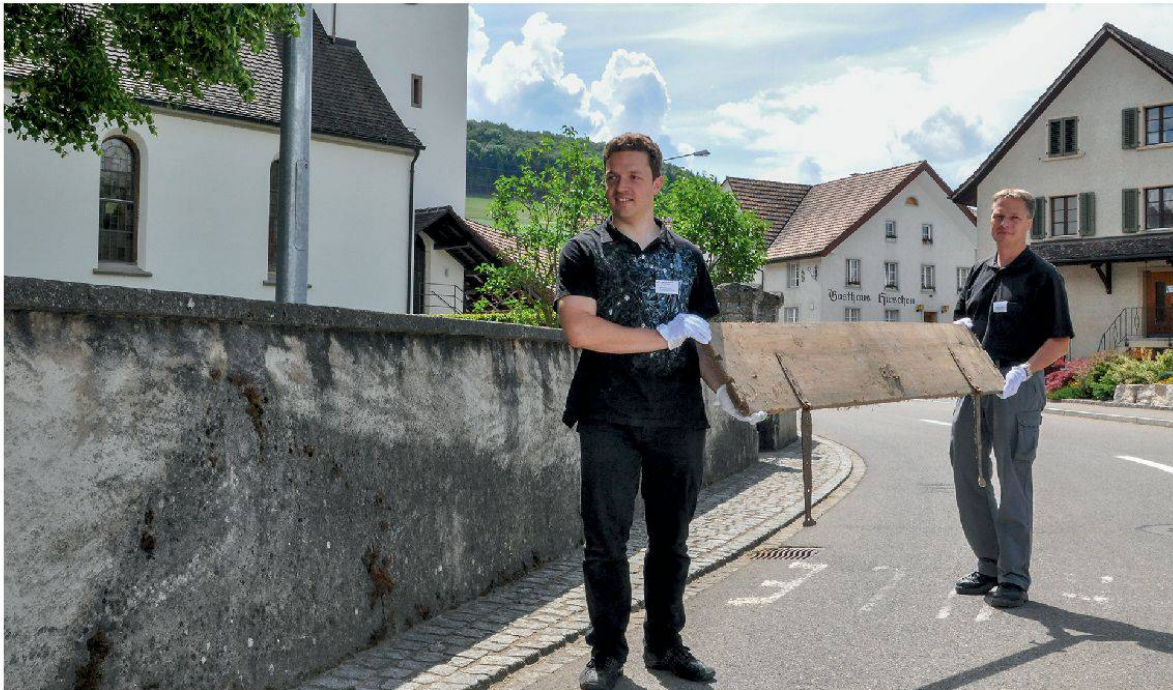
3 Zwei Mitarbeiter des Museum Aargau beim Abtransport eines Bretts des zerlegten «Pestsargs» von Mandach 2011.

mit einem Klappmechanismus ausgestattet, sondern mit Stiften aus Buchenholz von unten befestigt. Die in den 1940er-Jahren noch vorhandenen, seither aber zugrunde gegangenen Wände der Schmalseiten waren mit einer Schwalbenschwanzverzinkung mit den Seitenwänden verbunden.