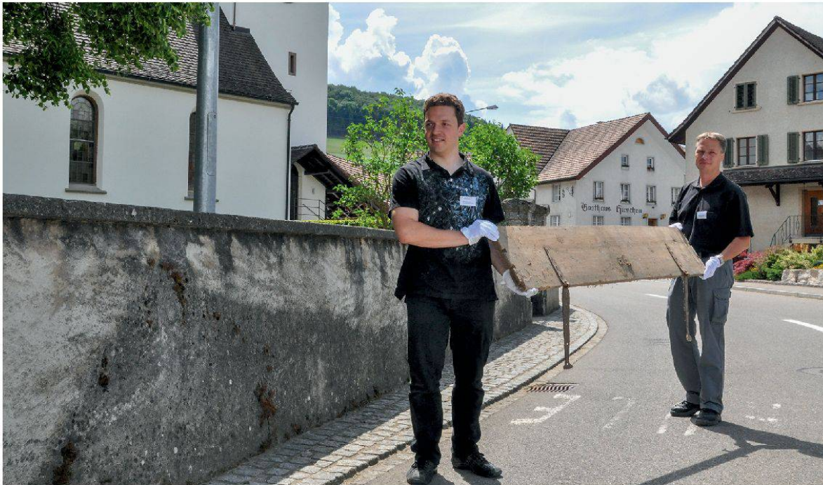
3 Zwei Mitarbeiter des Museum Aargau beim Abtransport eines Bretts des zerlegten «Pestsargs» von Mandach 2011.

mit einem Klappmechanismus ausgestattet, sondern mit Stiften aus Buchenholz von unten befestigt. Die in den 1940er-Jahren noch vorhandenen, seither aber zugrunde gegangenen Wände der Schmalseiten waren mit einer Schwalbenschwanzverzinkung mit den Seitenwänden verbunden.