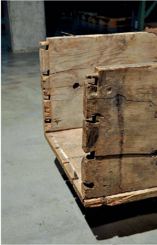
4 Trapezförmige Nuten an den Seitenwänden des Sargs zur Befestigung einer nicht mehr erhaltenen Schmalseite. Im Boden steckt noch ein Holzstift.

Übernahme der Bretter von den Sammlungsverantwortlichen des Museum Aargau bewusst als Teil der Objektgeschichte belassen, was auch aus konservatorischer Sicht trotz leichter Säurebildung unbedenklich ist.