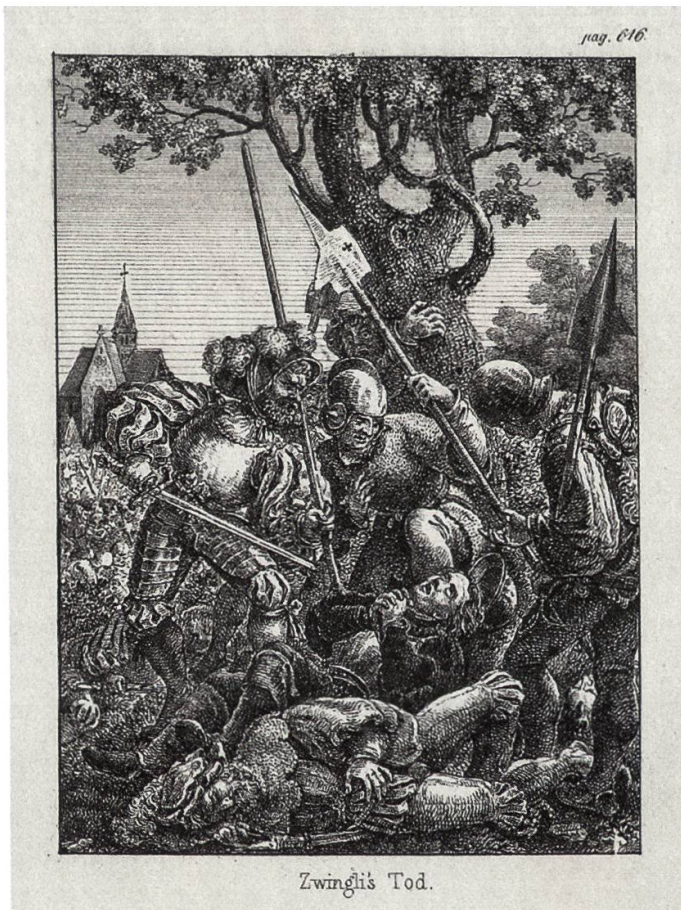
2 Zwingli's Tod, Darstellung von Franz Hegi, in: J. J. Hottinger, Huldreich Zwingli und seine Zeit dem Volk dargestellt. Zürich 1842.