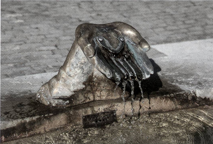
1 Die Zwillingshand des Brunnendenkmals in Villmergen (Foto: Dominik Sauerländer).

Eine gängige Art des «Wichtigmachens» besteht darin, dass man feststellt, dass das Ereignis keinen seiner Bedeutung entsprechenden Platz in der Schweizer Geschichte und im aktuellen Bewusstsein habe, dass das Thema möglicherweise sogar tabuisiert sei und vor dem Vergessen gerettet werden müsse. Die Feststellung, dass man ein Thema bisher «sträflich» vernachlässigt habe, ist allerdings eine häufig praktizierte rhetorische Floskel, mit der die eigene Beschäftigung gerechtfertigt wird. Dabei stellt sich freilich die Frage, wie man die verschiedenen Bedeutungen messen will, die bestimmte Themen gleichsam geniessen.