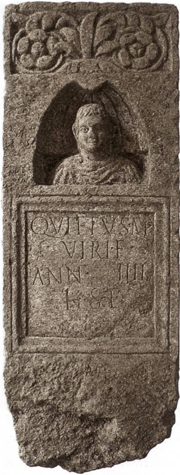
2 Brugg. Der besondere Fund – der am Remigersteig entdeckte römische Grabstein für den vierjährigen Knaben Quietus (Inv.Nr. Bru.012.2/978.1).