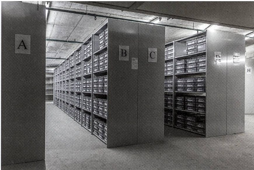
14 Das neu eingerichtete Lager an der Badenerstrasse in Brugg ergänzt unser Depot an der Industriestrasse, dessen Kistenregale vollständig belegt sind.

Das Projekt Nachbearbeitung Zurzach-Wasenacher (Freilegung, Dokumentation und Konservierung der Grabbeigaben aus dem frühmittelalterlichen Gräberfeld) konnte termingerecht abgeschlossen werden.