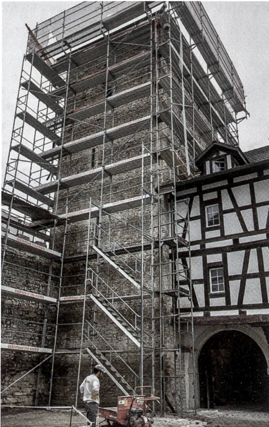
11 Schloss Wildenstein. Der eingerüstete Südwestturm während der Fassadensanierung. In halber Höhe ist der 1756 zugemauerte Hocheingang sichtbar.