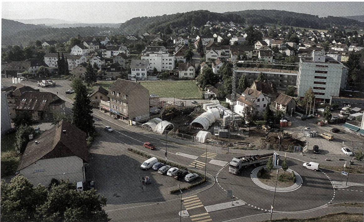
3 Windisch. Luftbild der Grossgrabung auf dem Areal Linde, Blick nach Südosten.