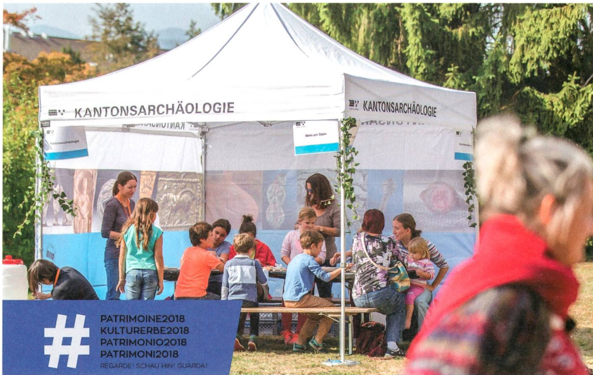
1 #Kulturerbe 2018 – «Schau hin!» – Kulturerbe-Tag in Zofingen.