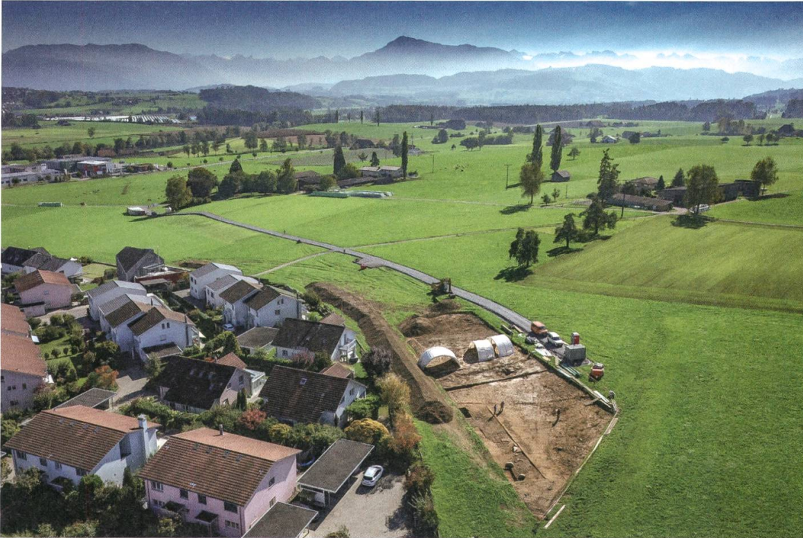
7 Sius. Das Areal der Grabung Südwestumfahrung mit Blick auf die Zentralschweizer Voralpenlandschaft (Sin.018.2).