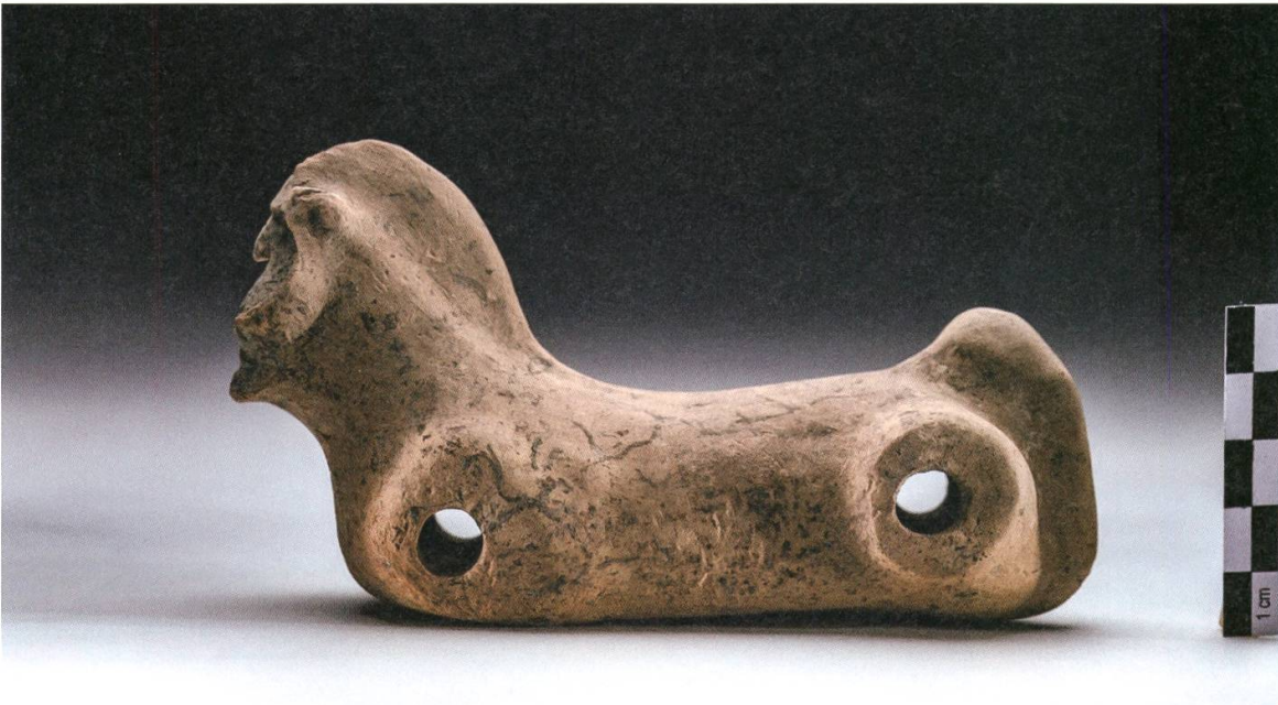
10 Baden. Ein aussergewöhnlicher Fund aus der Grabung Bäderquartier (B.018.1): römisches Spielzeugpferdchen aus Keramik (Inv.-Nr. B.018.1/596.1).