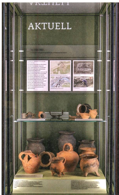
13 Vindonissa-Museum: Vitrine Aktuell 2018–2019 zum Thema «Armi Sieche» (Lau 013.1).

disch erfassten. So konnte mit einer Erfassungsquote von 96,7 Prozent des im Vorjahr eingegangenen Fundmaterials das für 2018 gesteckte Ziel erreicht werden, wenn auch teilweise nur die niedrigste Inventarisierungsqualität Q3 angewendet werden konnte.