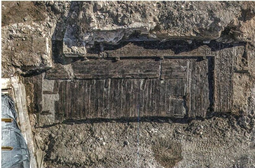
6 Baden. Altes Thermalbad/Staadhof: Luftaufnahme der Holzkonstruktion zur römerzeitlichen Badeanlage im Limmatknie (B.018.2).

festiert. Spuren prähistorischer Siedlungstätigkeit, wohl ebenfalls aus der Bronzezeit, zeichneten sich im untersuchten Bereich nur noch punktuell ab.