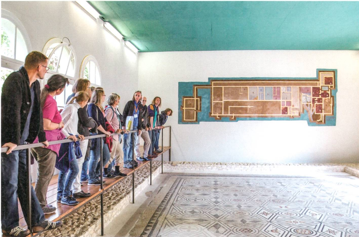
15 Zofingen. Am Kulturerbe-Tag vom 29. September 2018 erfuhren interessierte Besucherinnen und Besucher Wissenswertes zu den römischen Mosaiken.