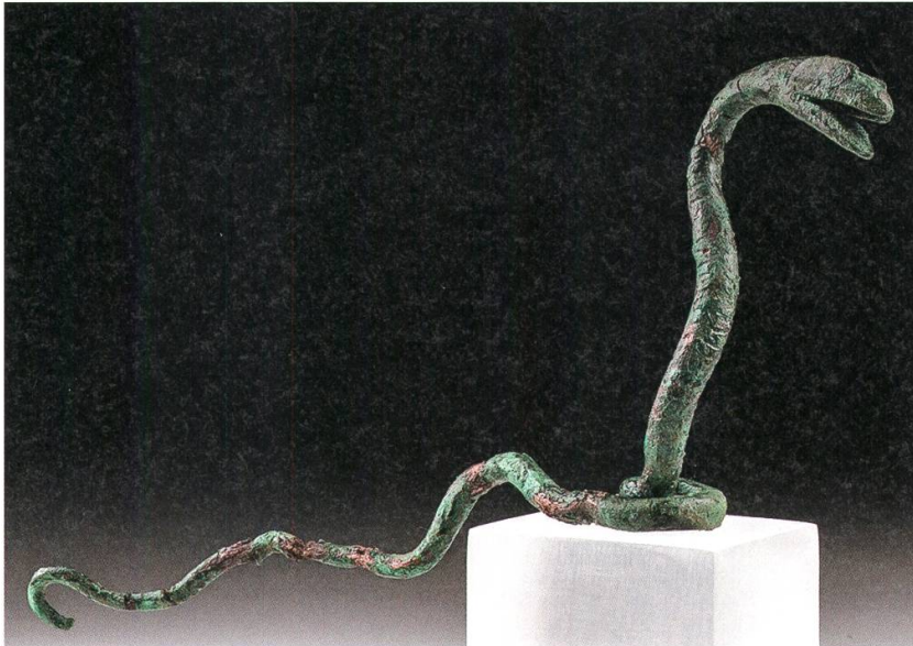
4 Windisch-Königsfelden/ PDAG: Der besondere Fund – eine kleine voll- plastische Schlange aus Bronze (V.016.2).