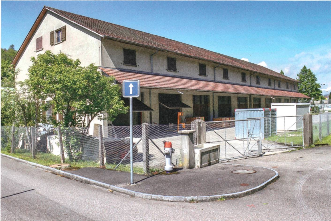
9 Windisch. Das ehemalige Armee-Zeughaus vor dem Ausbau zum Funddepot der Kantonsarchäologie.