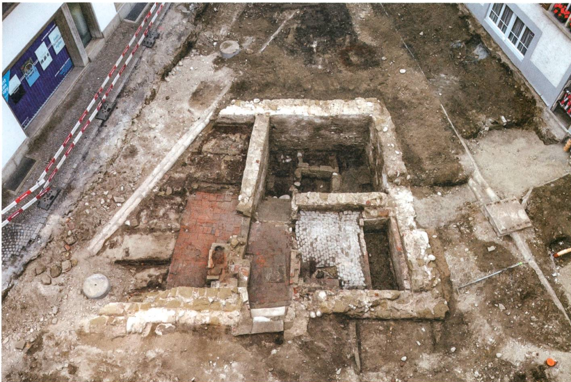
8 Zofingen. Gesamtauf sicht der Ausgrabungsfläche Obere Badestube aus Südwesten (Zof.018.2).