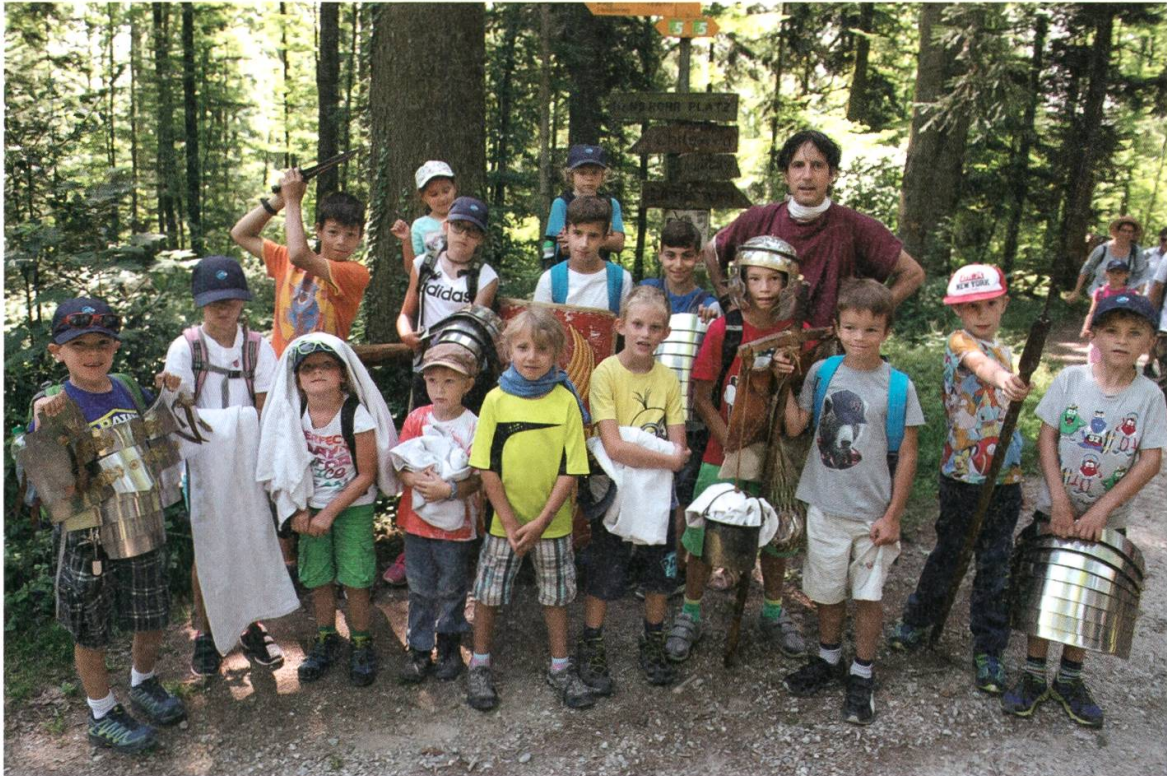
14 An der AZ-Leserwanderung vom 11. Juli 2018 überquerte eine Wandertruppe von 230 Leuten den 2000 Jahre alten Pass über den Bözberg. Dabei halfen die Kinder zwei Legionären, die schwere Ausrüstung zu tragen.