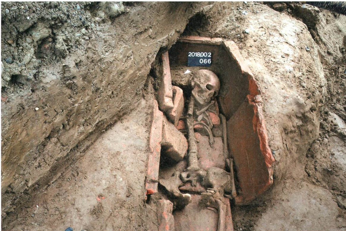
5 Kaiseraugst-Schürmatt. Blick von Nordwesten auf das freigelegte spätrömische Ziegelkistengrab (KA 2018.002).

stark gestört. Besonders hervorzuheben ist eine Bestattung, die in einer Ziegelkiste niedergelegt war. Die Gräber gehören zu dem seit Längerem bekannten spätantiken Gräberfeld Kaiseraugst-Höll westlich des Castrum Rauracense .