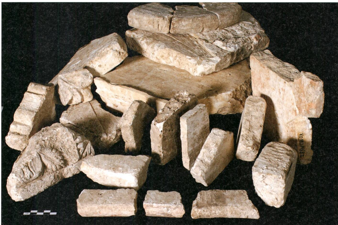
11 Fragmente der architektonischen Ausstattung der Basilika an der principia des Legionslagers von Vindonissa (V.018.2).