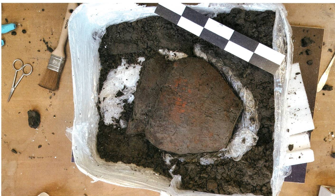
12 Ein als Block geborgenes bronzezeitliches Gefäss aus der Grabung Gränichen – Lochgasse (Gra.015.1) während der Bearbeitung im Restaurierungslabor.