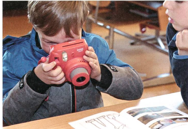
16 a–d: Schneisingen. Ein etwas anderer Schultag: Alle 97 Schulkinder der Primarschule nahmen im Vorfeld des Kulturerbe-Tages am 25. Oktober 2018 an einem Archäologie-Parcours der Kantonsarchäologie teil. An mehreren Stationen lernten sie die Arbeit der Archäologinnen und Archäologen kennen wie Ausgraben (a), Fundmaterial reinigen (b), Keramikgefässe restaurieren (c) und Auswerten (d).

Prospektoren zusammen, die mit dem Metalldetektor definierte Gebiete im Auftrag untersuchen. Im Rahmen des Freiwilligenprogramms der Abteilung Kultur konnte die Zusammenarbeit intensiviert werden. Erste Erfolge zeichnen sich bereits ab. Im Vorfeld des Kulturerbe-Tages wurde in Schneisingen ein kleines Projekt durchgeführt, um den Lagerplatz der russisch-österreichischen Truppen, die hier 1799 gelagert haben sollen, zu lokalisieren. Zwar konnte der Lagerplatz noch nicht lokalisiert werden, aber Funde wie Hufeisen, Musketenkugeln und Knöpfe lassen weiterhin hoffen.