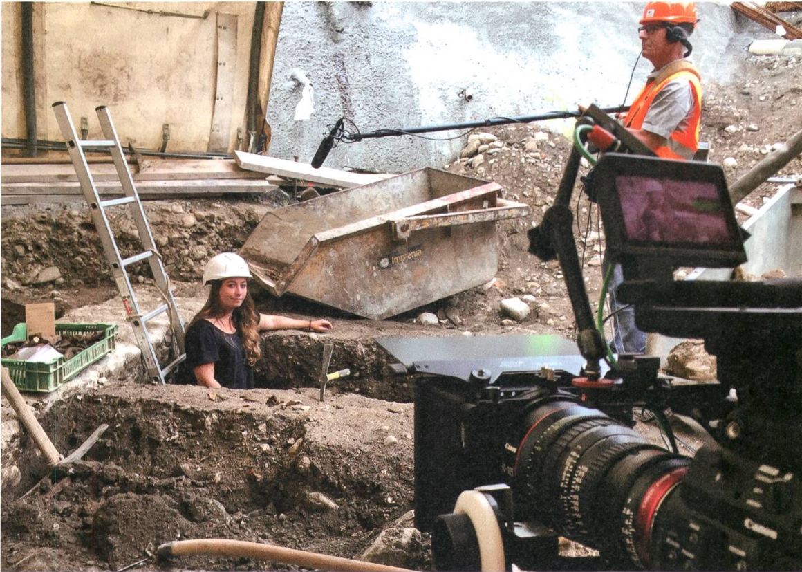
17 Videointerviews mit Mitarbeitenden der Kantonsarchäologie an realen Schauplätzen ergänzen die Sonderausstellung «Schätze aus Vindonissa – werde Archäologe!» im Vindonissa-Museum (26. 8. 2018–1. 9. 2019).

bis 1850 im Spiegel archäologischer Quellen, Basel 2018 (Akten des Kolloquiums SPM VIII, Bern 25./26.1. 2018), 195 f.