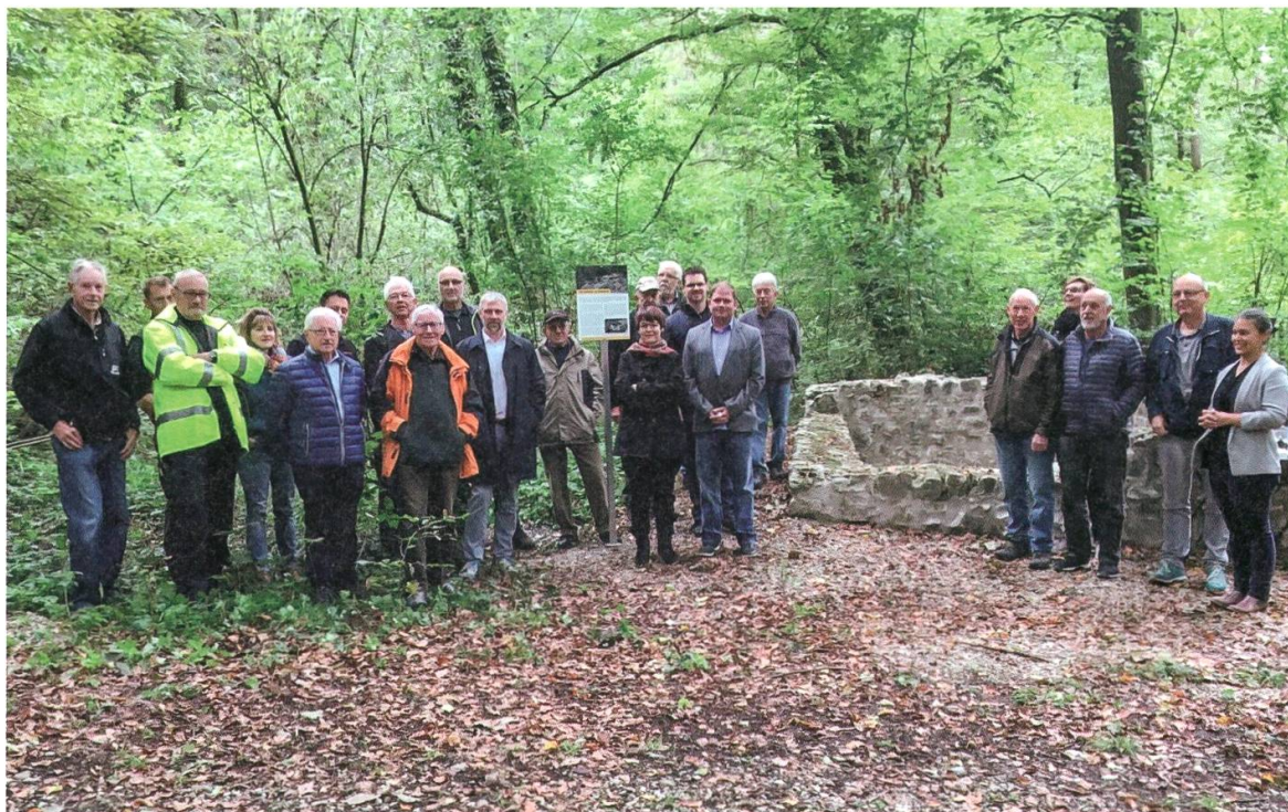
2 Kaisten. Der frühneuzeitliche Röstofen wurde saniert. Eine neue Informationstafel, die in Zusammenarbeit mit der Ortsbürgergemeinde Kaisten entstand, wird im Beisein von Gemeindevertretern eingeweiht.

publikumswirksamere Gestaltung dieses Denkmals wurden wichtige Vorarbeiten für die Erarbeitung einer Projektskizze geleistet. Parallel dazu läuft die Planung für eine ähnliche Aufwertung für die Grabhügel im Zigiholz in Sarmentorf.