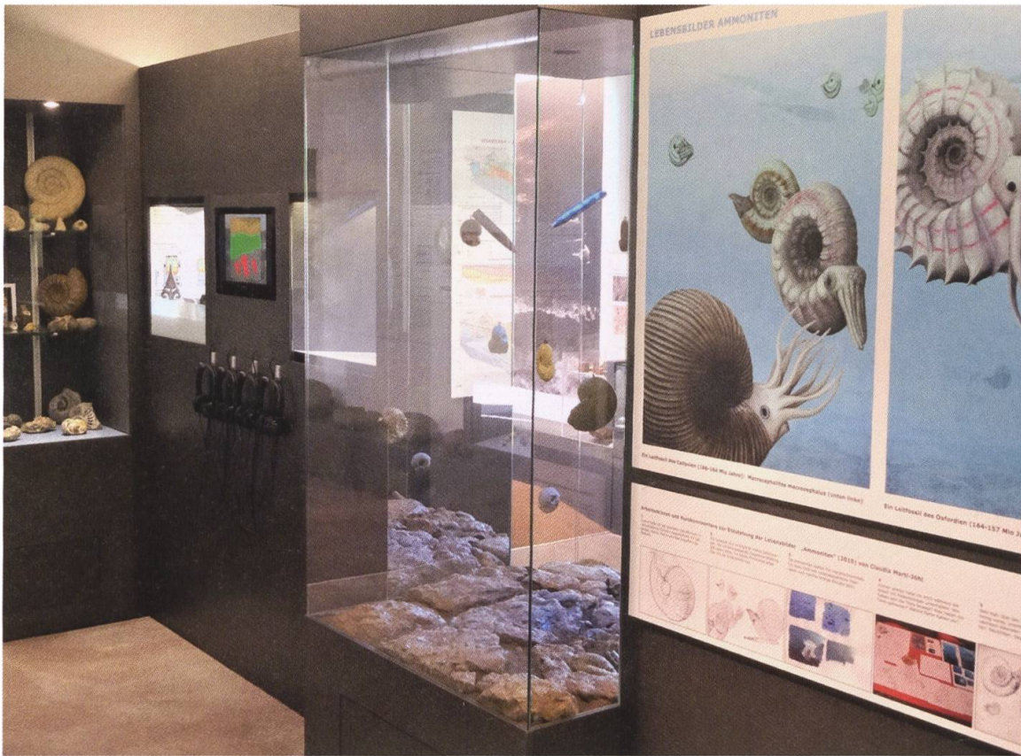
7 Blick in das kleine Museum, das einen konzentrierten Abriss über die Themen Bergwerk, Geologie und Ammoniten bietet (Foto: Geri Hirt, Linn).