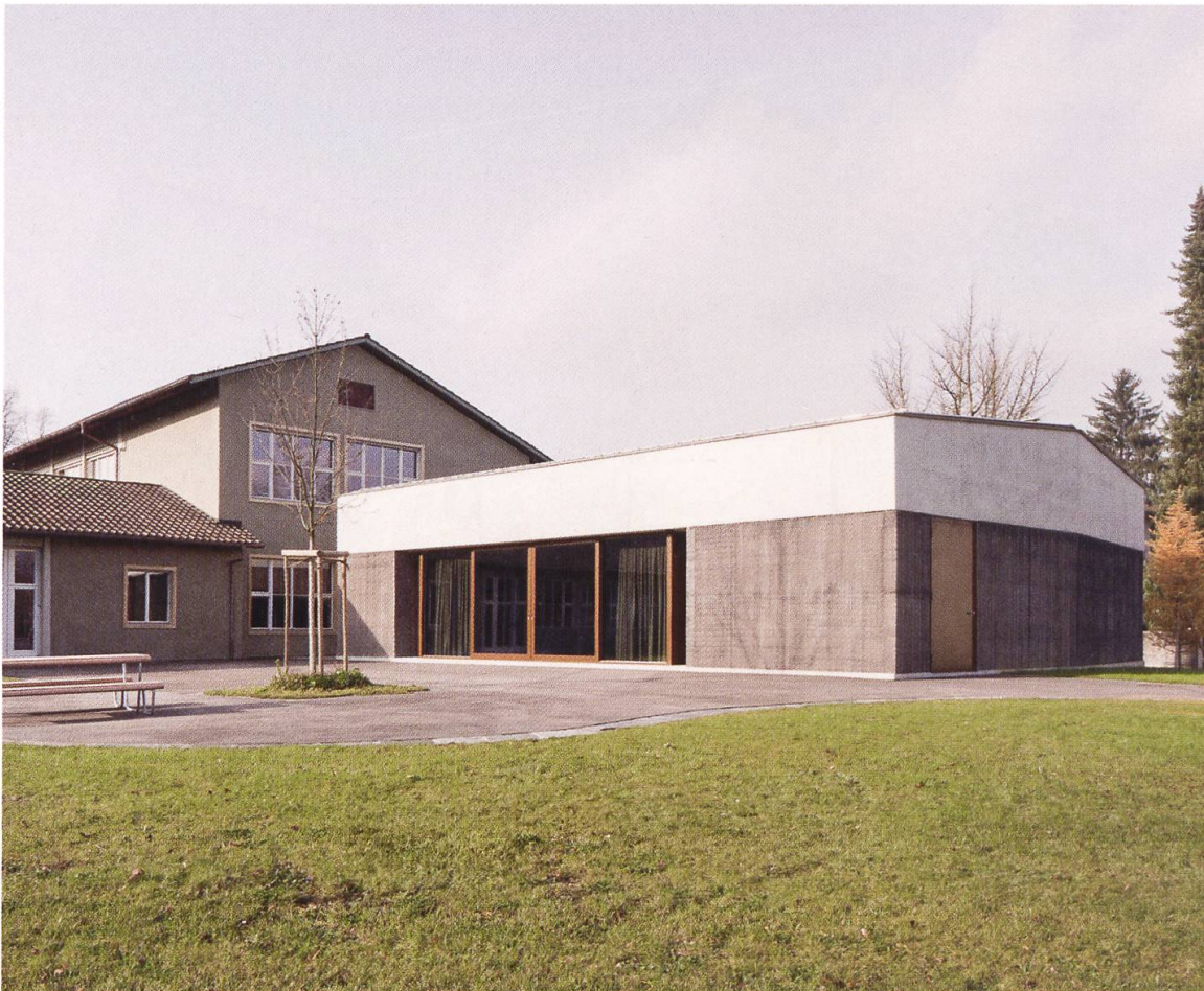
6 Aarau, Gönhardschulhaus, Hauri-Bau mit neu hinzugefügter Aula. Die 1952 fertiggestellte Schulanlage von Hans Hauri steht seit 2012 unter kantonalem Schutz und wurde 2010–2012 von Boltshauser Architekten restauriert und erweitert (Foto: © Kantonale Denkmalpflege Aargau, Beat Bühler, 2013).