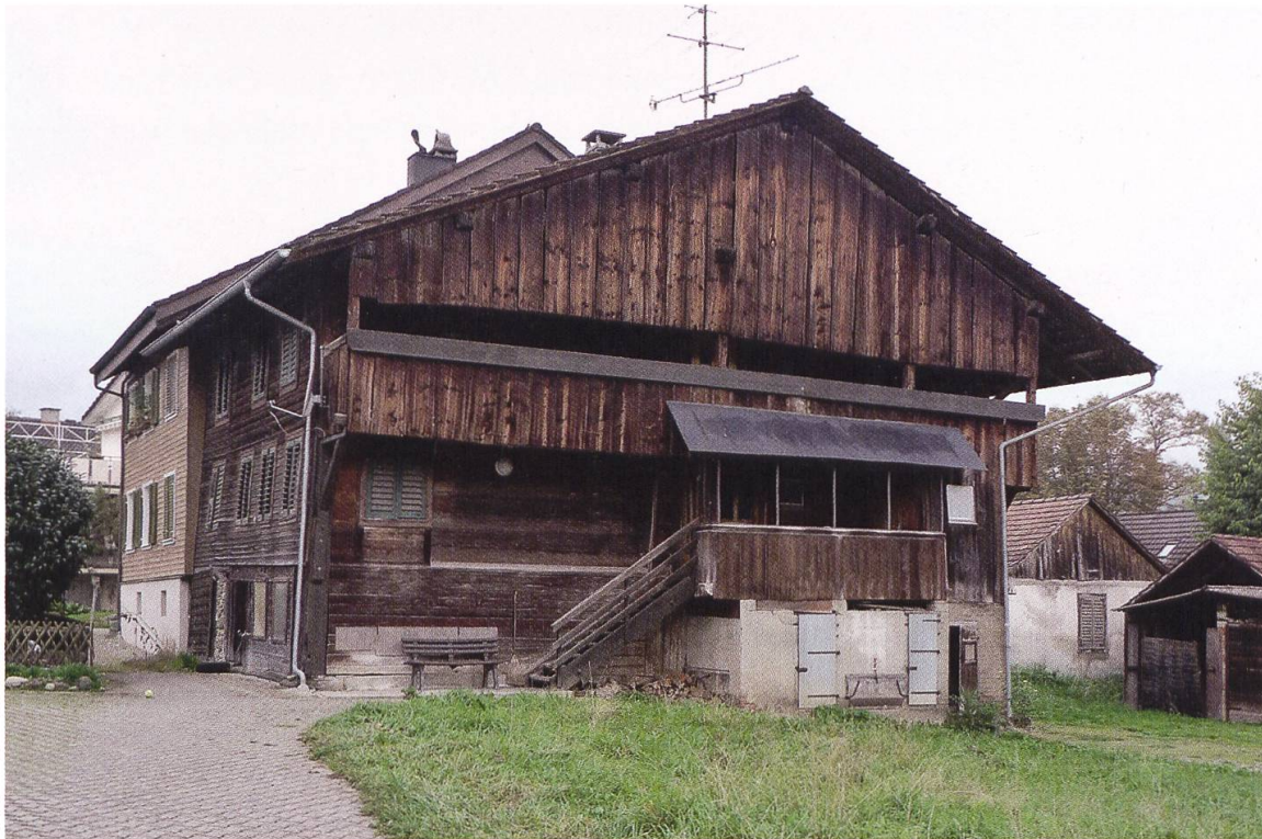
3 Auw, Wohnhaus an der Käsestrasse 13. Das im frühen 18. Jahrhundert vergrösserte Tätschhaus mit einem dendrodatierten Kernbau von 1469/70 wurde 2019 integral unter kantonalen Schutz gestellt (Foto: © Kantonale Denkmalpflege Aargau, Isabel Haupt, 2018).