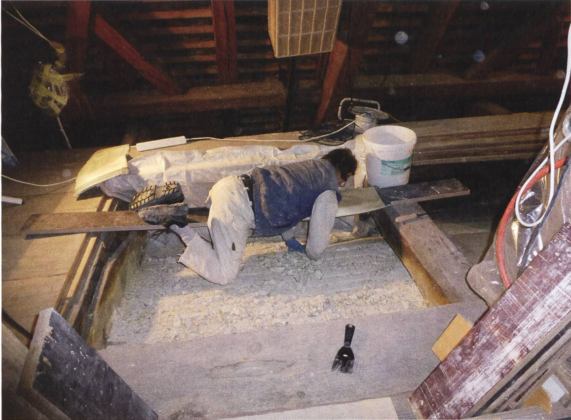
10 Kaiserstuhl, röm.-kath. Pfarrkirche St. Katharina. Der teilweise Absturz des barocken Deckengewölbes 2012 zog umfassende Konservierungsmassnahmen nach sich. Die Putzlattenkonstruktion der Gipstonne über dem Kirchenschiff wurde vom Dach aus gesichert.