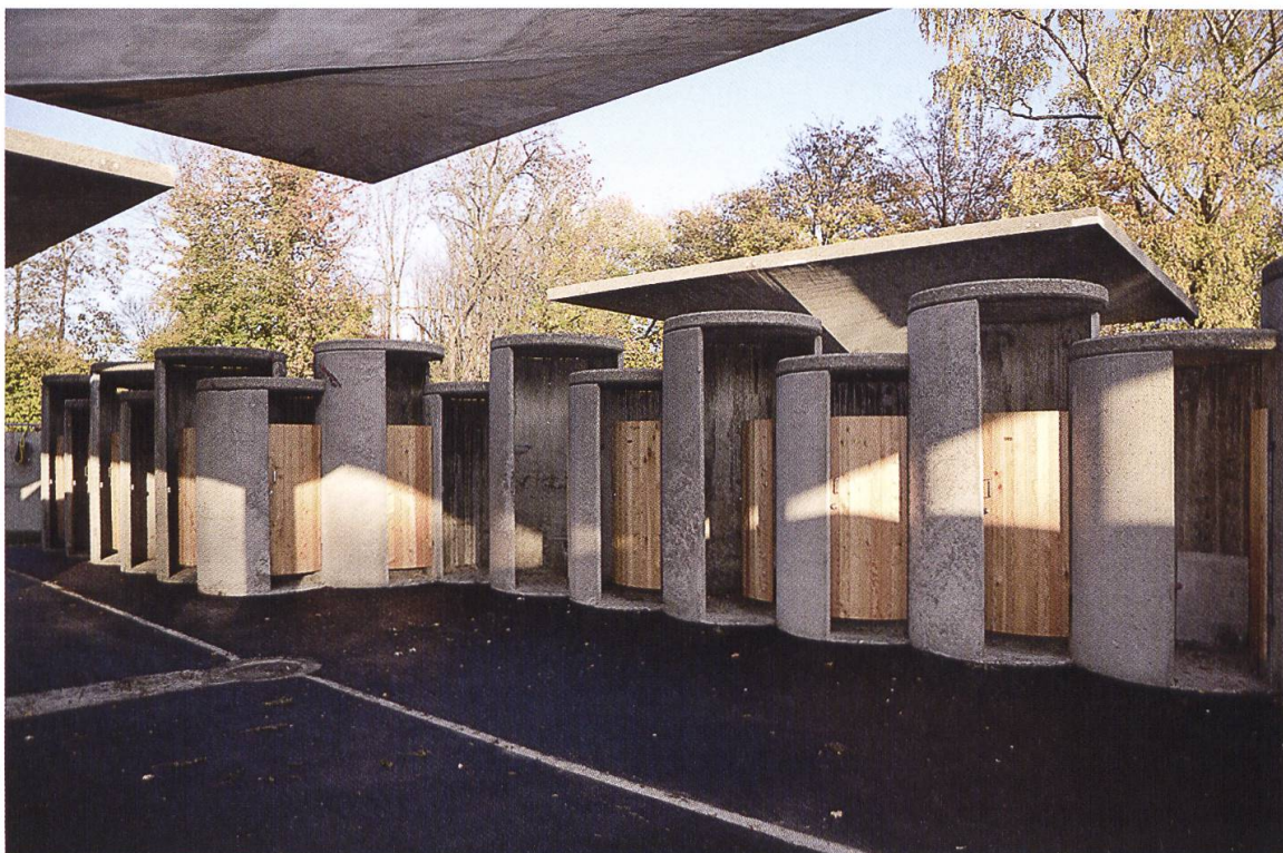
4 Wohlen, Freibad Bünz matt. Das 1965/66 von Dolf Schnebli erbaute Freibad Bünz matt in Wohlen, das unter anderem durch Pilzdächer und zylinderförmige Umkleidekabinen charakterisiert ist, steht seit 2017 unter kantonaalem Schutz (Foto: © Kantonale Denkmalpflege Aargau, Isabel Haupt, 2018).