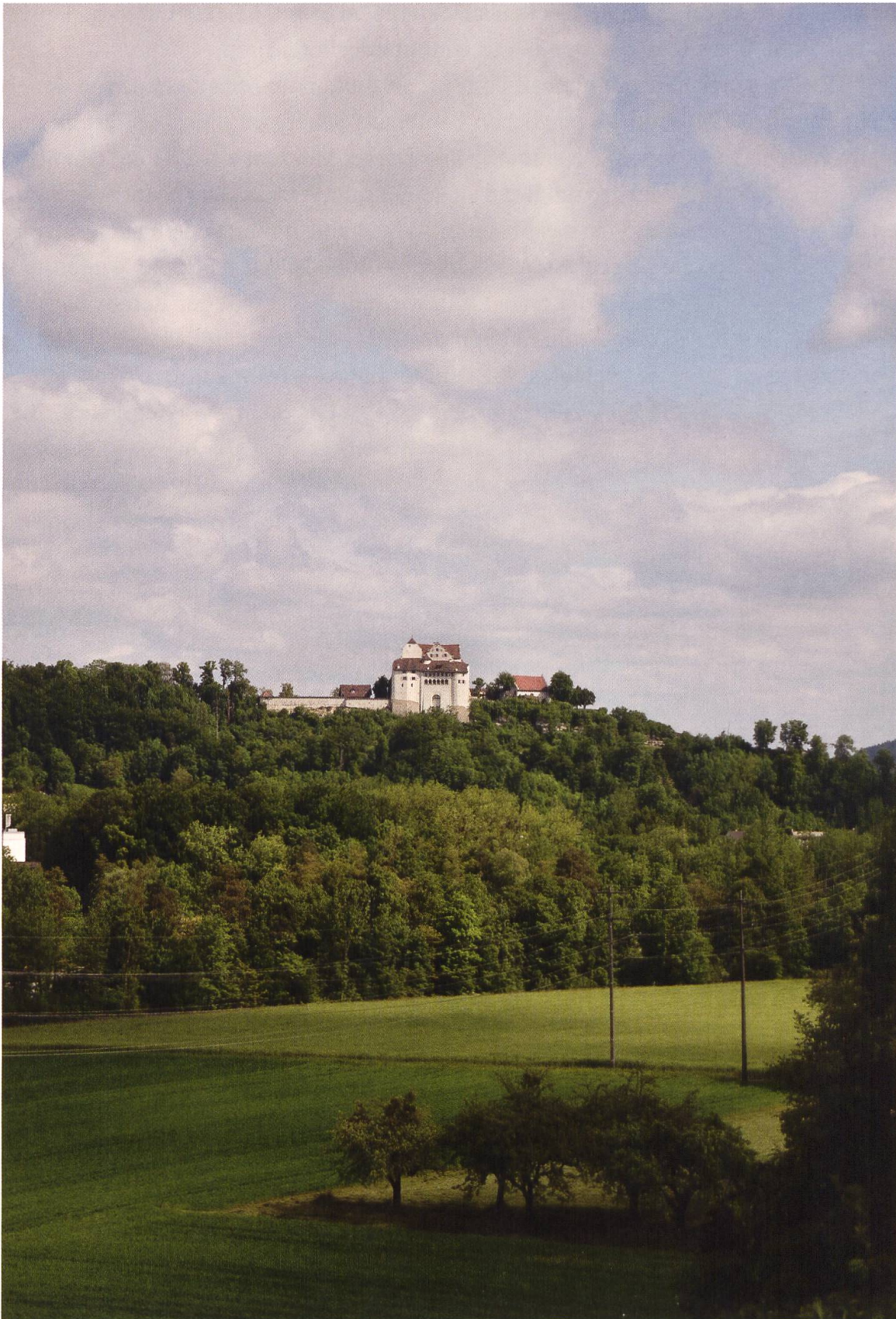
9 Möriken-Wildegg, Schloss Wildegg. Die mittelalterliche Burg hat sich im Lauf der Jahrhunderte zum herrschaftlichen Patriziersitz und zum Museum gewandelt und wurde vor ihrer Integration in das Museum Aargau umfassend renoviert.