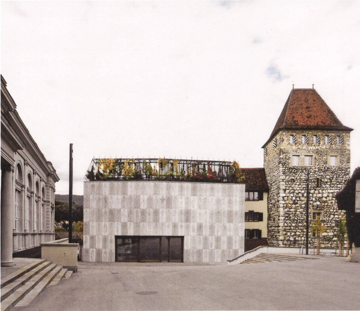
8 Aarau, Stadtmuseum Aarau. Die Räumlichkeiten des Museums erstrecken sich sowohl auf das «Schlössli», einen wehrhaften Turm aus dem 13. Jahrhundert, wie auf den 2015 fertiggestellten Erweiterungsbau der Architekten Diener&Diener und Martin Steinmann.