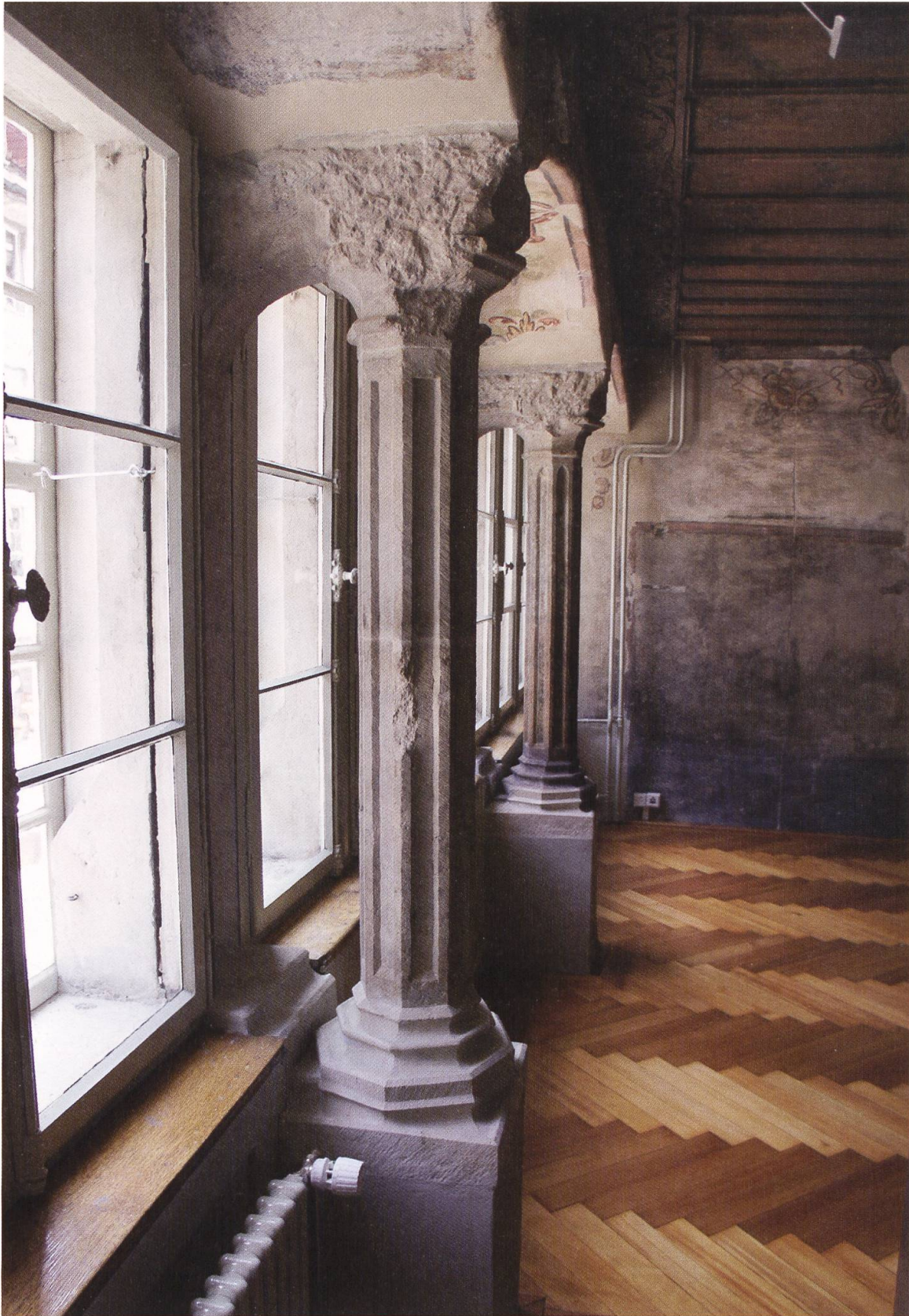
11 Aarau, Altstadtthaus an der Rathausgasse 22, spätgotische Fenstersäulen, Decke mit spätgotischer Flachschnitzerei und barocke Wandmalerei, die eine Reinigung mit einem speziellen Laser erfuhr (Foto: © Kantonale Denkmalpflege Aargau, 2013).