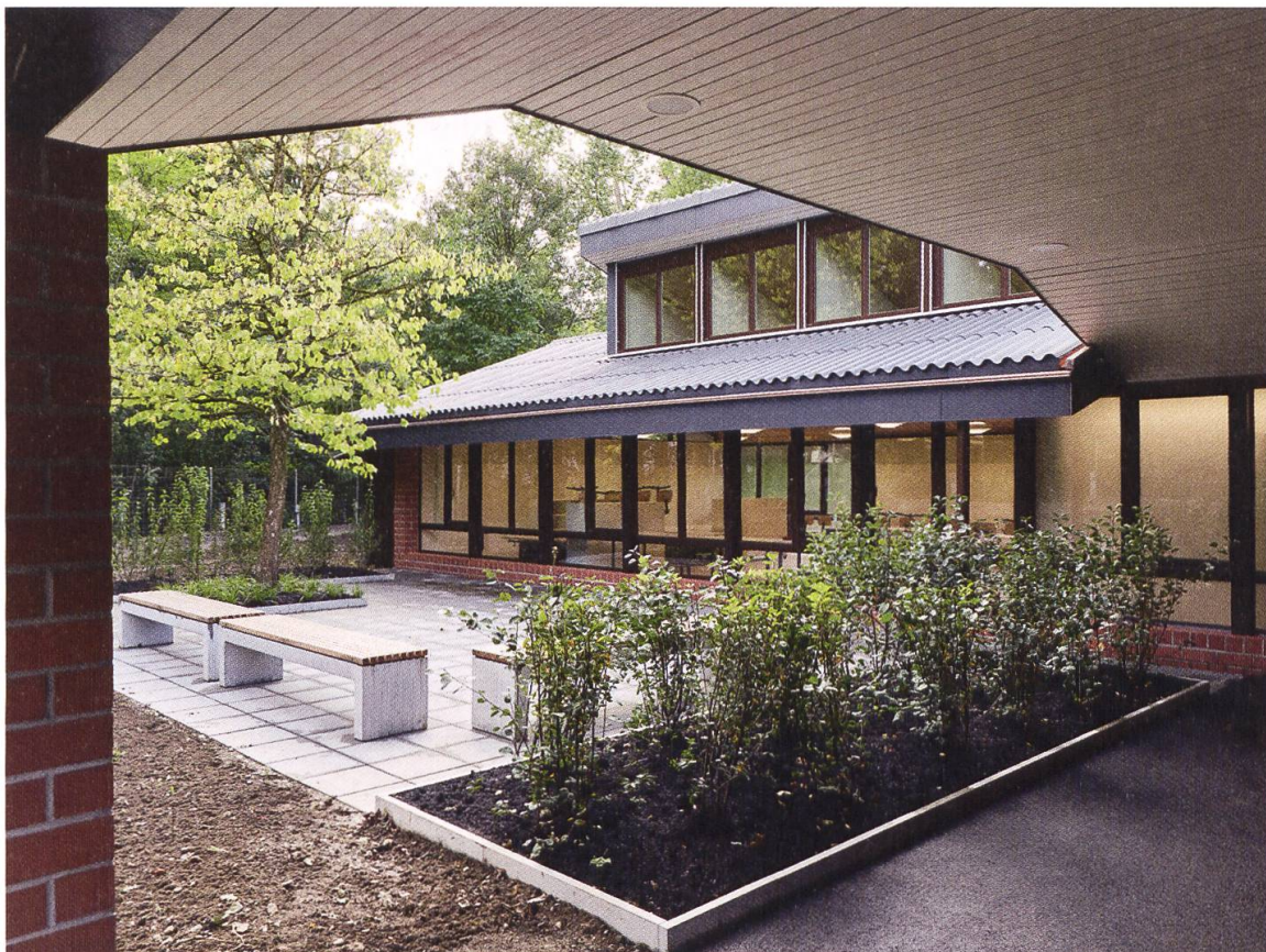
15 Möriken-Wildegg, Schulanlage Hellmatt, Innenhof. Die Anlage mit Klassenpavillons und zugeordneten Gartenhöfen wurde 1967–1978 vom Architekturbüro Metron gebaut, 2013 unter kantonalen Schutz gestellt und bis 2018 renoviert und ertüchtigt.