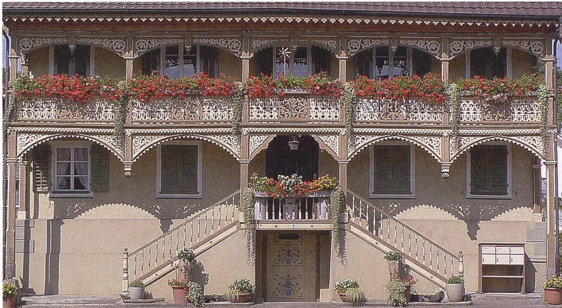
1 Dietwil, Vorderdorfstrasse 1. Das aus dem Jahr 1767 stammende stattliche «Freiämterhaus», das 1892 einen Laubenvorbau in den Formen des Schweizer Holzstils erhielt, wird im 2013 aktualisierten Bauinventar der Gemeinde Dietwil gewürdigt.