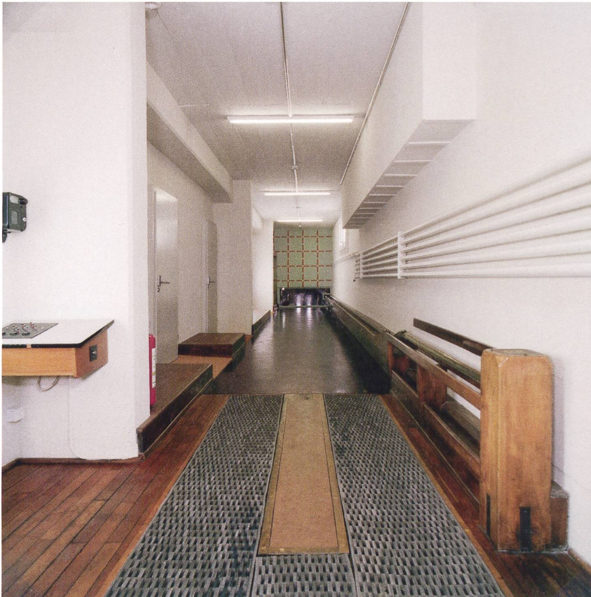
14 Möhlin, Bata-Kolonie, Clubhaus. Im 1948 nach Plänen von Hannibal Naef erbauten Clubhaus dient die ehemalige Kegelbahn heute als Erschliessung für neu eingebaute Hotelzimmer (Foto: © Kantonale Denkmalpflege Aargau, Christine Seiler, 2019).