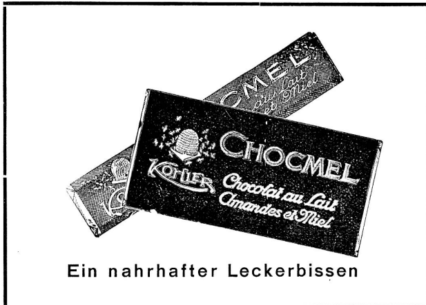
Ein nahrhafter Leckerbissen

Trainings-Schiessen: Jeden Donnerstag Abend ab ca. 18.00 Uhr steht in der Rehalp eine Scheibe zur Verfügung derjenigen Kameraden, die sich bis spätestens Donnerstag mittags beim Obmann angemeldet haben (Telephon 71.012 — Bäckerei Flückiger). Uebungsdoppel kann gratis geschossen werden, daneben können aber auch Marken gelöst werden für jede andere Stichscheibe. Ebenfalls das Jahresprogramm kann an einem Donnerstag geschossen werden. Wir hoffen jeden Donnerstag eine Anzahl Kameraden in unserem Schiessstand anzutreffen. Es ist dies die beste Gelegenheit, um für Rorschach zu trainieren. Der Schiessvorstand.