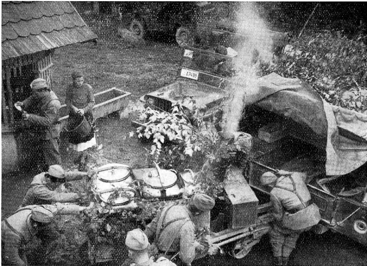
Hier wird eine mobile Truppenküche an einen Lastwagen angehängt und zur Einheit gebracht.