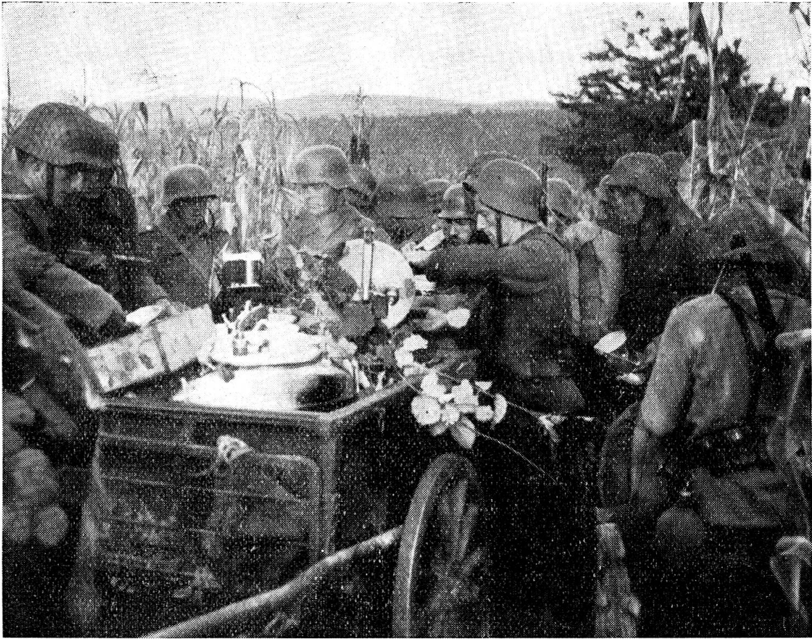
Jugoslawien: Manöververpflegung aus der mobilen Truppenküche