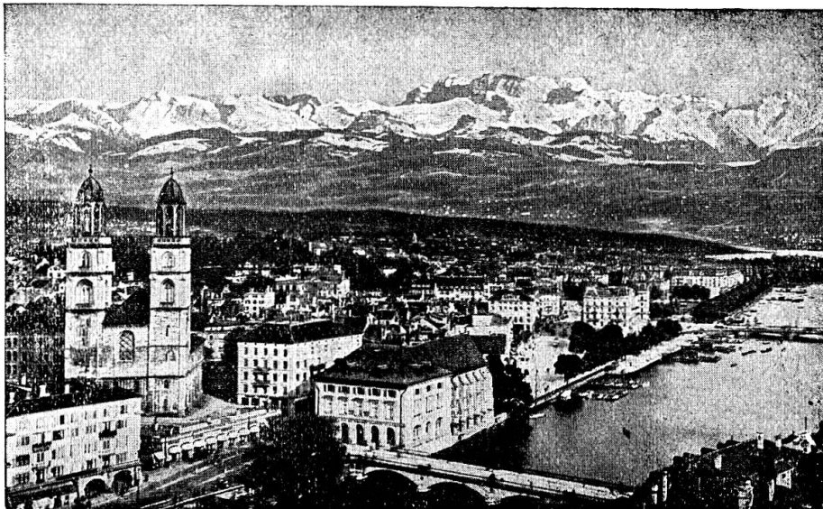
Grossmünster und die Alpen