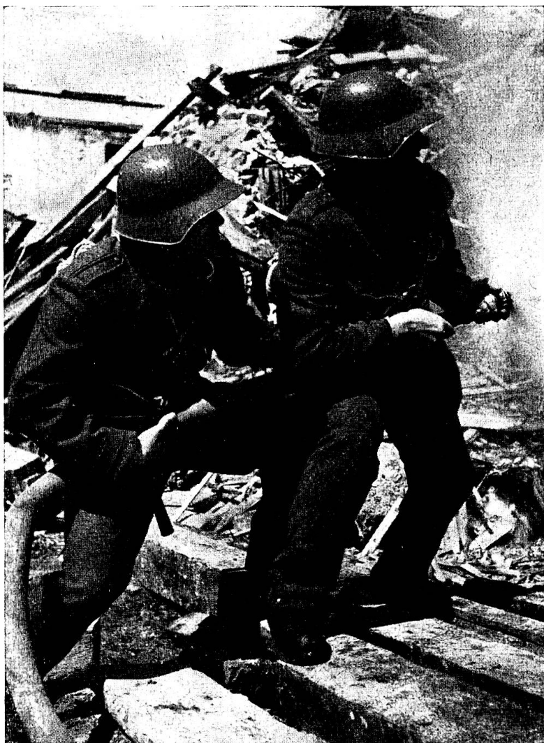
Unsere Luftschutztruppen im Einsatz. Es braucht eine gute und realistische Schulung um im Feuersturm, in Qualm und Hitze einer bombardierten Ortschaft seine Pflicht zu erfüllen

der Freiwilligkeit beruht, wie es im Vorentwurf des Gesetzes für die Frauen vorgesehen ist. Es ist aber angesichts der heutigen Mentalität fraglich, ob damit genügend Leute gefunden werden könnten. Diese Frage ist es aber wert, dass sie weiterhin auf mögliche Lösungen hin studiert wird.