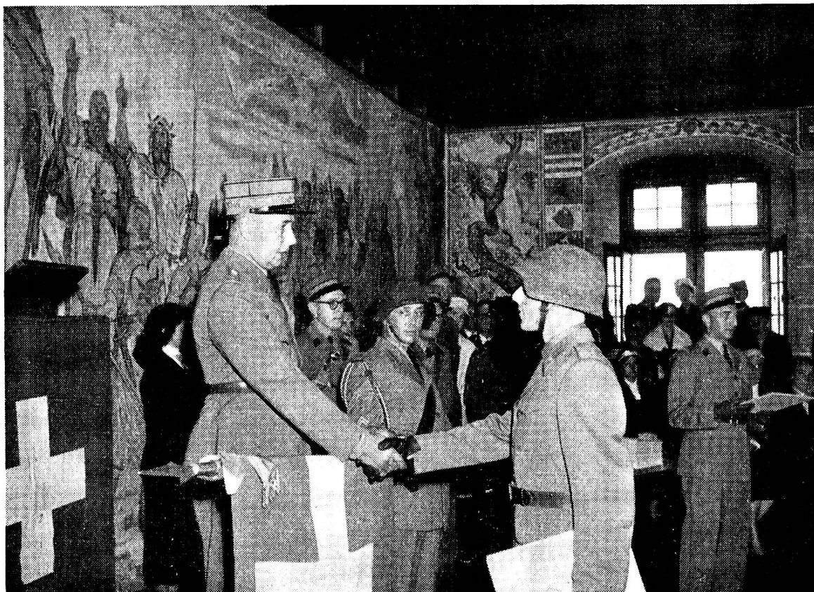
Ein erhebender Augenblick in der Laufbahn eines Offiziers: Die Brevetierung.

Diese Aufnahme stammt von der Brevetierung der Vpf. OS 2 | 1957